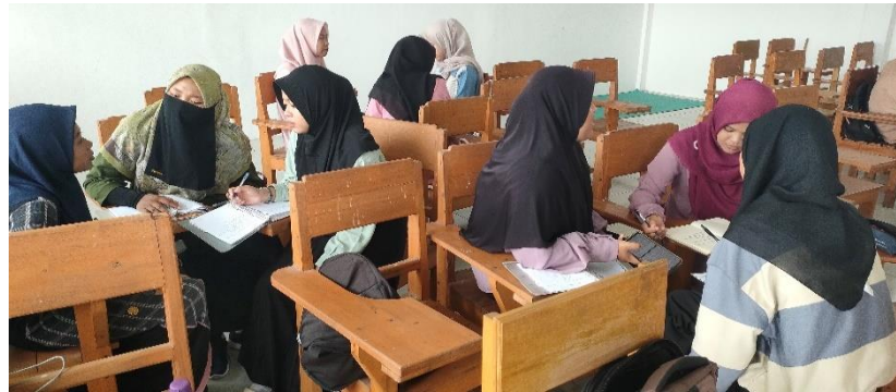
Gambar 3. Praktik penulisan secara berkelompok

penelitian mereka. Kemudian, dengan adanya pelatihan ini, membuat mahasiswa menjadi lebih senang dengan belajar dalam kelompok. Seperti yang terlihat pada gambar 3, mahasiswa belajar bersama-sama untuk menulis sebuah pendahuluan. Hal ini mengimplikasikan bahwa tingkat keterlibatan mahasiswa dalam belajar lebih meningkat.