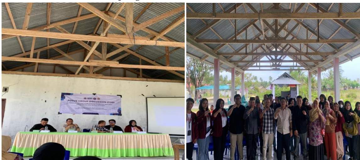
Gambar 1 : Kegiatan penyuluhan penggunaan dana desa

Kegiatan penyuluhan menghadirkan Kepala Dinas Pemberdayaan Masyarakat dan Desa Kabupaten Pohuwato serta akademisi yang berkecimpung dalam pengelolaan keuangan daerah. Pemilihan terhadap narasumber yang terdiri dari akademisi dan dari unsur pemerintah ini menjadi penting karena akan secara seimbang membahas regulasi dan praktek pelaksanaan yang didukung dengan teori serta makna filosofis pengelolaan dana desa.