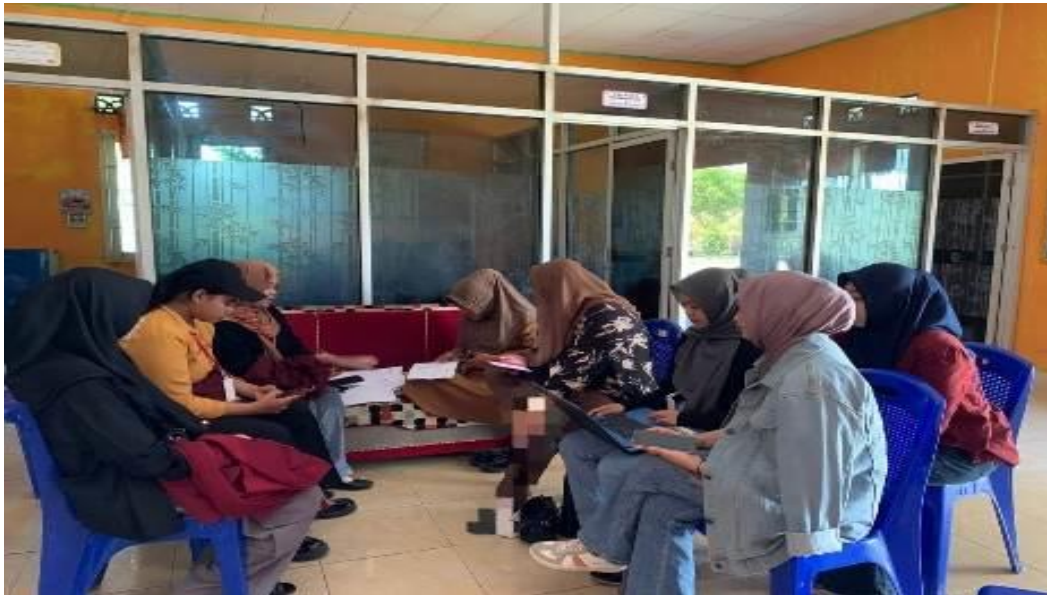
Gambar 2 : Pelatihan pengelolaan keuangan desa berbasis Microsoft