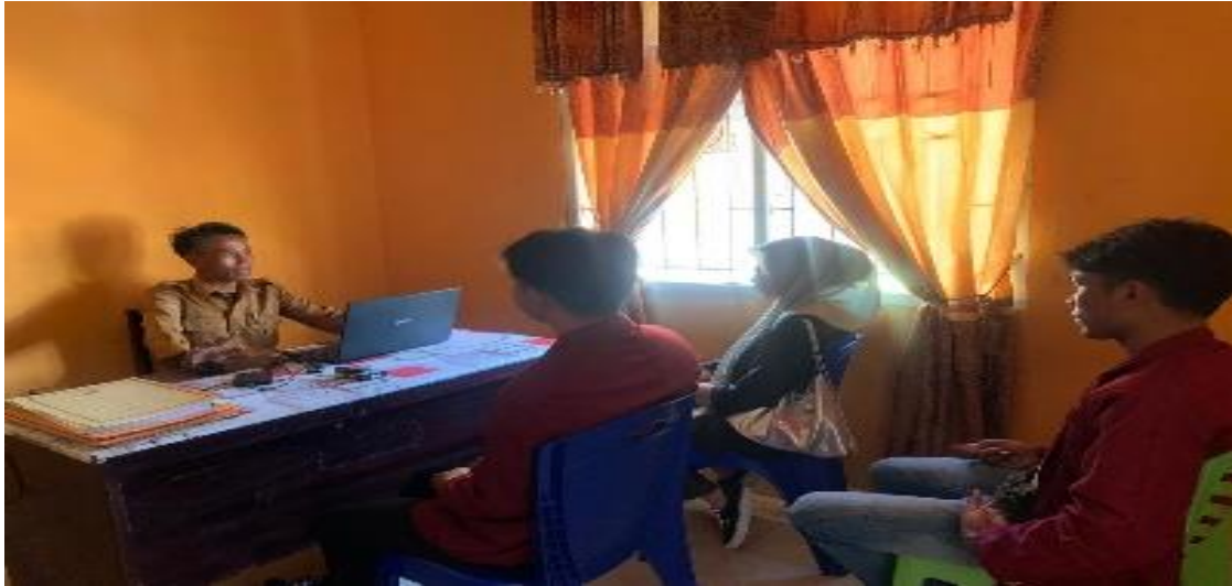
Gambar 3 : Proses konsultasi dan koordinasi model media informasi desa berbasis digital

Hasil akhir dari pelaksanaan pengabdian yang membentuk media sosial informasi desa yang berbasis digital merupakan salah satu bentuk mewujudkan transparansi dan akuntabilitas penggunaan dana desa. selain itu, dengan adanya media ini akan memberikan ruang terhadap partisipasi masyarakat dalam pengawasan penggunaan dana desa yang dilakukan dalam berbagai bentuk program maupun kegiatan.