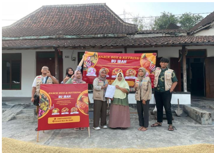
Gambar 4. Penyerahan Dukungan Atribut-Atribut Promosi Usaha

Berdasarkan hasil pendampingan yang telah dilaksanakan, kegiatan tersebut telah meningkatkan pengetahuan dan keterampilan digital pelaku Usaha, Mikro, Kecil, dan Menengah yang terlibat dalam kegiatan ini. Terdapat inovasi baru oleh pelaku Usaha, Mikro, Kecil, dan Menengah yang dapat memperkuat strategi pemasaran dan diharapkan inovasi-inovasi ini juga berpotensi meningkatkan daya saing serta penjualan produk. Selain itu, adanya kegiatan ini juga meningkatkan kesadaran bagi para pelaku Usaha, Mikro, Kecil, dan Menengah mengenai pentingnya pendaftaran perizinan berusaha yang dapat membantu memperkuat keabsahan dan kepatuhan hukum usaha para pelaku Usaha, Mikro, Kecil, dan Menengah sehingga akan meningkatkan kepercayaan konsumen maupun mitra bisnis.