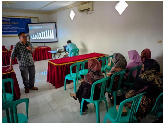
Gambar 1. Dokumentasi Kegiatan Sosialisasi UMKM

digitalisasi dan inovasi melalui sosialisasi dan pendampingan. Kegiatan sosialisasi diikuti oleh peserta yang merupakan pelaku Usaha, Mikro, Kecil, dan Menengah pada Desa Banjarejo. Kegiatan sosialisasi ini dilaksanakan pada hari Kamis, 8 Agustus 2024 di Aula Desa Banjarejo. dengan tema “Transformasi Digital untuk Pertumbuhan dan Keberlanjutan UMKM dalam Memajukan Ekonomi Daerah”.