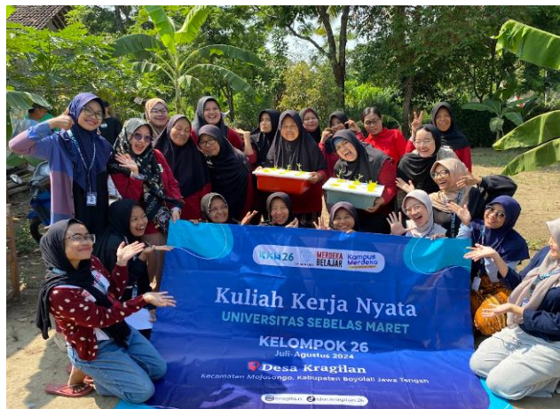
Gambar 4. Pelaksanaan Sosialisasi dan Praktik "Hidroponik Mandiri Desa"

Tahap pelaksanaan dilakukan pada tanggal 28 Juli 2024 di kebun gizi RT Bibisari. Pada tahap ini, dilaksanakan sosialisasi dan praktik penanaman hidroponik bersama anggota PKK yang mengelola kebun gizi. Acara diawali dengan pemberian materi, sesi tanya jawab, praktik penanaman hidroponik bersama yang dibantu oleh mahasiswa KKN, dan ditutup dengan sesi