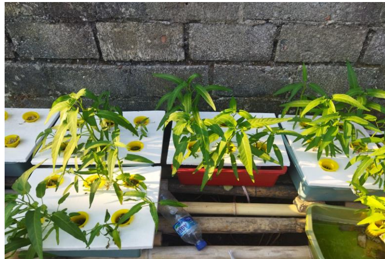
Gambar 5. Tanaman Hidroponik Kangkung Siap Panen

Tahap panen dilakukan pada tanggal 21 Agustus 2024. Pada tahap panen ini, mahasiswa KKN bersama dengan salah satu anggota PKK Bibisari bekerja sama dalam mencabut tanaman yang siap panen. Panen pertama ini menghasilkan tiga ikat sayuran kangkung yang kemudian diberikan kepada warga. Setelah panen dilakukan, warga Bibisari mulai menanam benih tanaman lain yang sudah mereka persiapkan sebelumnya secara mandiri sehingga program hidroponik ini menjadi program yang berkelanjutan.