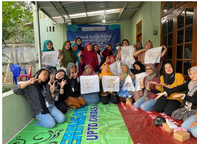
Gambar 6. Pelaksanaan Sosialisasi dan Praktik “Pengenalan Budaya Batik”

Pelaksanaan program kerja berlangsung pada tanggal 6 Agustus 2024 yang berlokasi di posko perempuan KKN UNS. Acara dimulai dengan sesi sosialisasi yang berisi pemaparan materi tentang budaya batik sebagai salah satu budaya Indonesia yang dilanjutkan dengan sesi tanya jawab. Setelah sosialisasi dilakukan, acara dilanjutkan dengan praktik membatik menggunakan canting yang dilakukan oleh warga secara bersama-sama dengan mahasiswa KKN. Acara ditutup dengan sesi dokumentasi antara anggota PKK dan mahasiswa KKN.