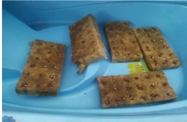
Gambar 3. Penyemaian Benih Kangkung Hidroponik

Tahap persiapan dilakukan selama dua minggu, dari 13 Juli hingga 27 Juli 2024. Tahap persiapan dilakukan dengan menyemai 90 benih kangkung hingga menjadi bibit siap tanam selama dua minggu. Selain itu, tahap persiapan juga dilakukan untuk mempersiapkan alat, bahan, dan tempat yang akan digunakan sosialisasi dan praktik.