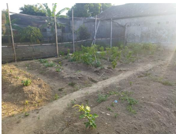
Gambar 2. Kondisi Lahan Kebun Gizi Bibisari

Pelaksanaan program kerja “Hidroponik Mandiri Desa” dilakukan untuk menanggulangi salah satu problematika yang ditemukan selama masa observasi. Berdasarkan observasi yang dilakukan, Desa Kragilan memiliki satu kebun gizi yang berada di RT Bibisari yang digunakan untuk menanam berbagai sayuran sebagai sumber pangan masyarakat desa, khususnya RT Bibisari. Namun, kebun gizi di RT Bibisari mengalami kekeringan sehingga hanya tanaman cabai yang dapat bertahan di kondisi tersebut.