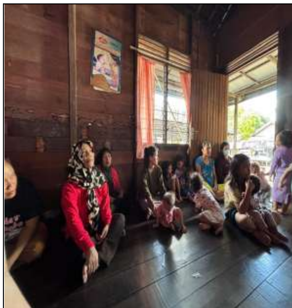
Gambar 1. Kegiatan pendataan dan kegiatan pre-test

Hasil lain yang diperoleh dari kegiatan tersebut adalah meningkatnya partisipasi aktif masyarakat dalam program KB. Sebagian besar peserta menyatakan bahwa mereka kini lebih yakin dalam memilih metode kontrasepsi yang sesuai dengan kebutuhan mereka. Ini bukan hanya menunjukkan perubahan dalam cara orang menghadapi keluarga berencana, tapi juga menunjukkan bahwa penyuluhan berhasil dalam mengatasi kesalahpahaman dan hambatan sosial yang sering menghalangi penerimaan program KB khususnya di Wilayah Kerja Puskesmas Ketapang I Kabupaten Kotawaringin Timur.