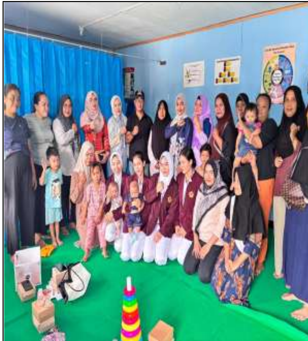
Gambar 3. Bersama peserta, tim puskesmas, kader dan pak camat