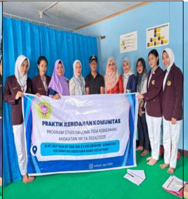
Gambar 4. Bersama Tim puskesmas, kader, pak camat dan mahasiswa bidan