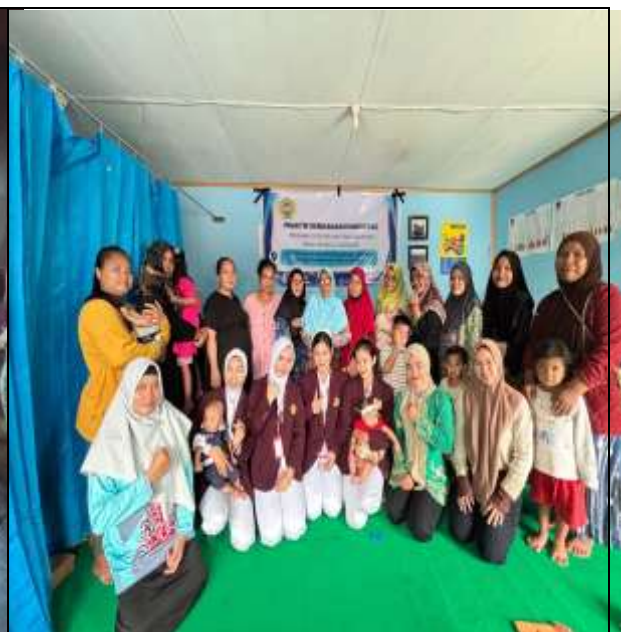
Gambar 2. Kegiatan pasca penyuluhan