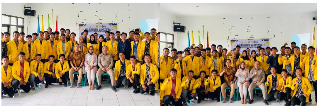
Gambar 4. Rangkaian Acara Kegiatan Pengabdian kepada Masyarakat (PkM) PJKR Universitas Suryakencana

berwirausaha di sektor industri olahraga. Dengan demikian, kondisi ini memberikan pemahaman dan dampak yang kuat mengenai pentingnya pemanfaatan teknologi terbaru di era digital bagi sportpreneur dengan framework sport industry 4.0 .