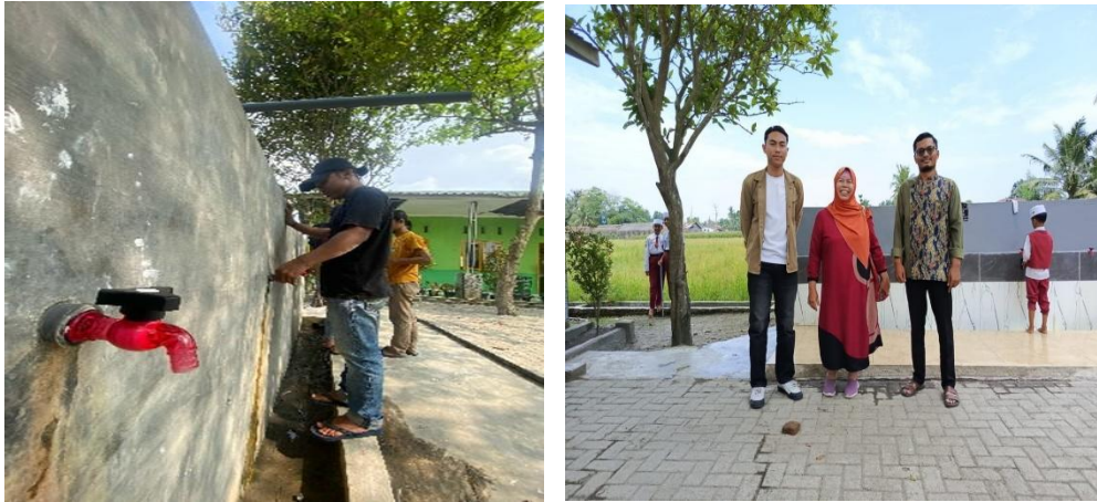
Gambar 2: Peserta Pengabdian Masyarakat