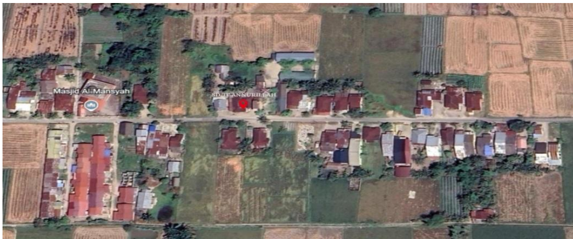
Gambar 1: Lokasi Pengabdian Masyarakat

Pelaksanaan kegiatan revitalisasi ini hendaknya tidak hanya menjadi proyek satu kali, tetapi harus diintegrasikan sebagai bagian dari kebijakan dan budaya sekolah. Dengan demikian, warga sekolah dapat membangun kesadaran tujuan bersama untuk terus memelihara dan mengembangkan fasilitas yang ada, sehingga dapat menunjang pelayanan pendidikan yang berkualitas. Dengan dukungan semua pihak, terutama kepala sekolah, guru, siswa, dan orang tua, revitalisasi fasilitas ini dapat berjalan efektif dan menghasilkan dampak positif yang luas bagi kemajuan sekolah secara keseluruhan.