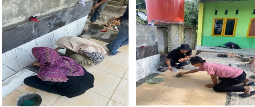
Gambar 3. Pelaksanaan Pengabdian Masyarakat