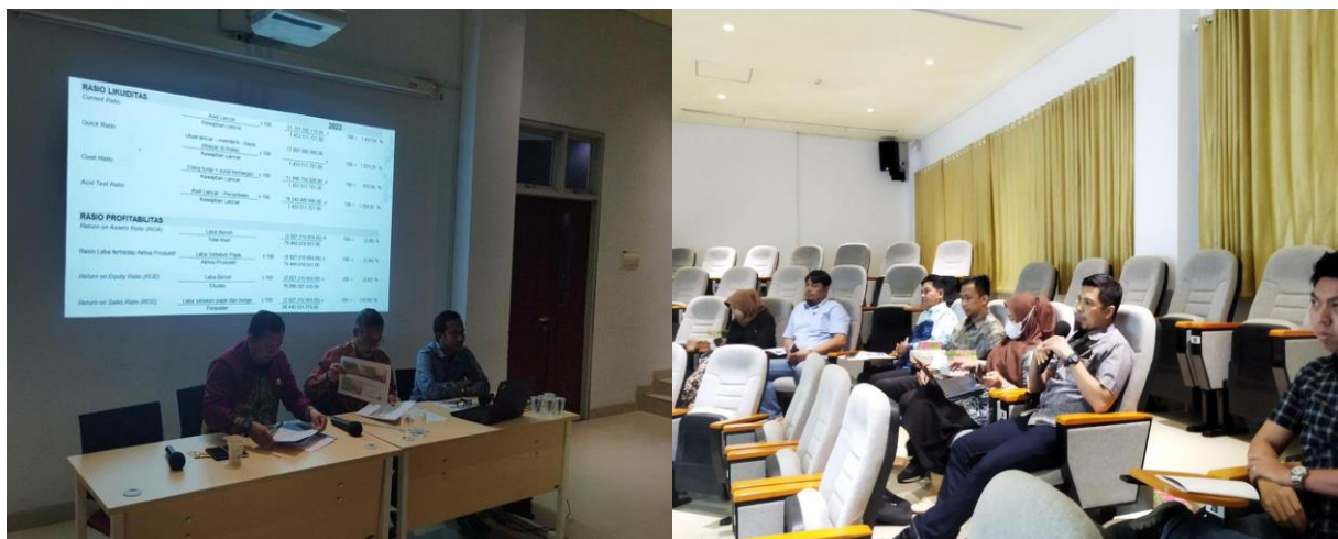
Gambar 3. Dokumentasi Pelaksanaan Focus Group Discussion