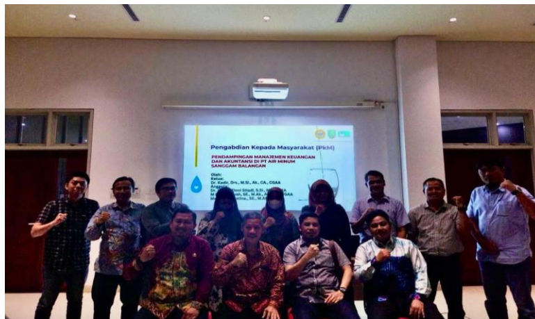
Gambar 2. Dokumentasi Pelaksanaan Pelatihan

Pada tahap persiapan, tim pengabdian melakukan survei awal terhadap permasalahan, kebutuhan serta tantangan yang dihadapi oleh mitra, kemudian dilakukan studi literatur mencari dasar dalam menjawab permasalahan mitra. Berdasarkan hasil tahap persiapan maka disusun rencana pendampingan yang mencakup sasaran, target, dan strategi yang akan digunakan dalam pelaksanaan pendampingan. Pada tahap pelaksanaan, dilakukan konsultasi dan pembelajaran kolaboratif (pelatihan) manajemen keuangan dasar dalam situasi praktis dan pencatatan akuntansi.