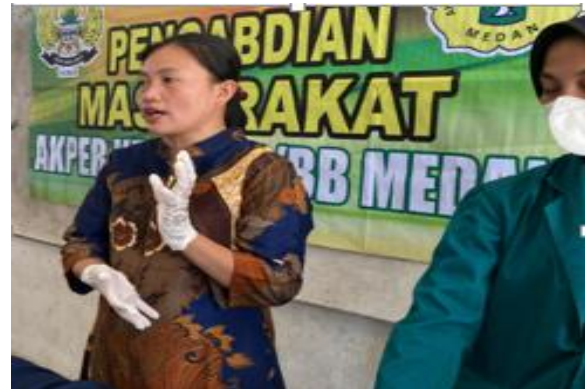
Gambar 2. Demonstrasi Balutan pada ekstremitas atas