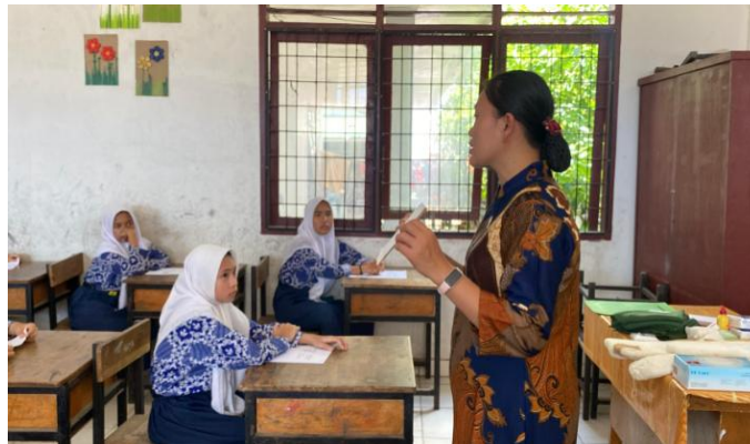
Gambar 1. Penyampaian materi Balutan