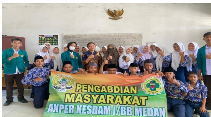
Gambar 4. Dokumentasi kegiatan pengabdian masyarakat dosen, mahasiswa dan siswa