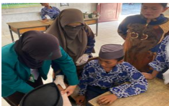
Gambar 3. Siswa melakukan balutan pada lengan atas temannya sendiri