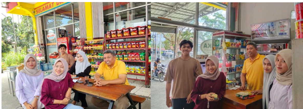
Gambar 1. Potret Tim Pengabdian Bersama Pemilik Minimarket Malika

Melalui penggunaan Gampang Toko, Minimarket Malika telah menjalankan pencatatan transaksi keuangan dan stok barang secara otomatis tanpa lagi mengandalkan pencatatan manual. Penggunaan sistem ini mendukung efisiensi dan ketepatan dalam proses pelaporan serta mempermudah pemilik usaha dalam mengontrol kegiatan operasional harian. Meskipun aplikasi ini bukan sistem ERP secara penuh, namun fitur-fitur yang mencakup manajemen stok, laporan keuangan, dan penjualan sudah menggambarkan karakteristik ERP skala UMKM, karena adanya integrasi antara beberapa fungsi bisnis dalam satu sistem.