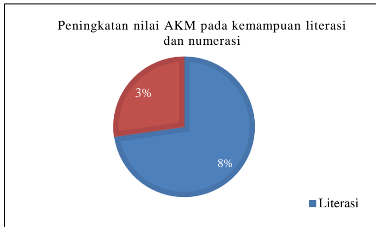
Gambar 7. Diagram batang hasil peningkatan literasi dan numerasi

Refleksi dan evaluasi implementasi program hal baik yang didapatkan selama masa penugasan yaitu terkait sikap kepedulian antar sesama, peduli akan hal kecil yang terabaikan dan menjadi manfaat bagi sesama. Program-program MBKM diyakini bermanfaat untuk meningkatkan kompetensi tambahan dan relevan dengan kebutuhan lulusan di masa mendatang (Meke, dkk., 2022). Selain itu, hal baik yang dirasakan oleh mahasiswa selama masa penugasan yaitu terkait bagaimana bersikap dan berinteraksi baik terhadap siswa dan guru. Kemudian, kerja sama tim juga menjadi nilai penting dalam suatu program. Berdasarkan persepsi mahasiswa, program kampus mengajar tidak hanya memberikan pengalaman mengajar dalam kelas, tetapi juga dapat membantu meningkatkan kemampuan bekerja sama dan soft skill mahasiswa (Suwanti, dkk., 2022). Implementasi kegiatan Kampus Mengajar dapat memberikan modal terhadap mahasiswa untuk menjadi diri yang memiliki loyalitas dan dedikasi yang tinggi pada negara melalui pendidikan, mahasiswa juga dapat menambah wawasan dan pengalaman di luar perguruan tinggi (Fisabillillah & Rahmadanik, 2022). Adapun tantangan yang dihadapi selama masa penugasan yaitu terkait manajemen waktu. Terkadang, program yang dilaksanakan tersebut masih terteter dengan kegiatan-kegiatan lain sehingga memungkinkan program lainnya terlupakan. Selain itu, tantangan dalam hal mengondisikan peserta didik. Dengan sifat dari peserta didik yang beragam, cukup menjadi tantangan tersendiri dalam hal mengarahkannya.