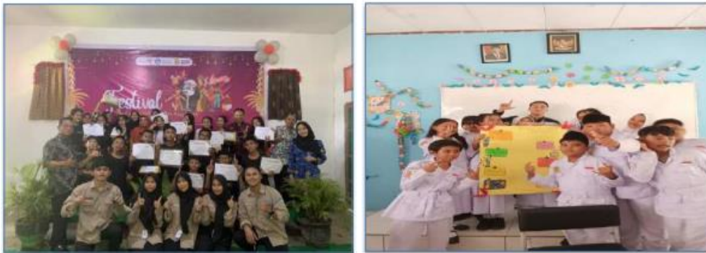
Gambar 3. Kegiatan bulan bahasa

festival kampus mengajar yang diadakan sehingga dalam kegiatan festival juga memasukkan unsur literasi seperti lomba baca puisi, lomba poster digital, dan lomba menghias kelas. Hasil setelah kegiatan ini ruang kelas menjadi literat dengan dilengkapinya informasi seperti jadwal piket, mading kelas yang berisi informasi seperti jadwal mata pelajaran, dan lain-lain yang juga berkaitan dengan kebersihan.