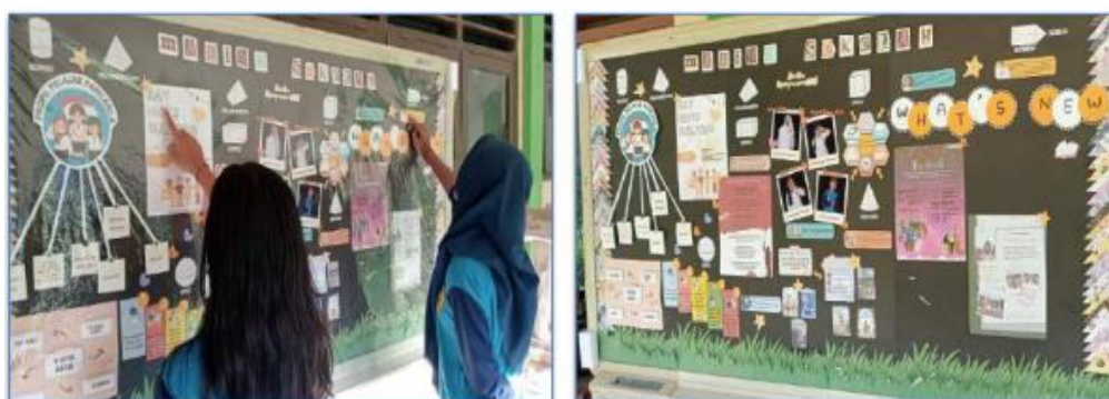
Gambar 1. Pembuatan mading sekolah