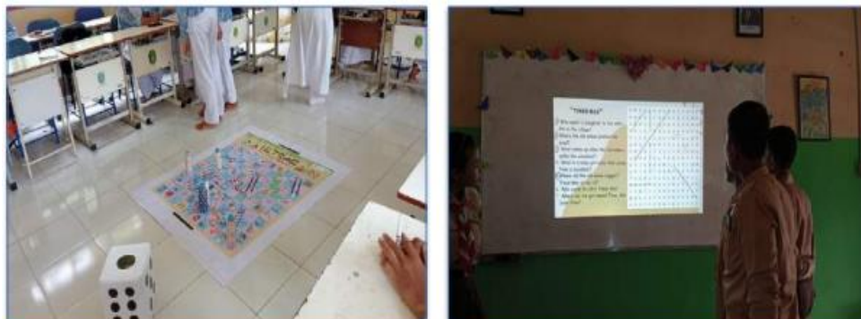
Gambar 4. Pengajaran literasi numerasi di kelas