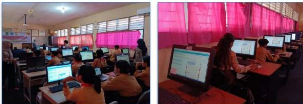
Gambar 6. Pelaksanaan kegiatan post-tes AKM

Hasil dari pelaksanaan pre-test pada literasi sebesar 32% dan pre-test numerasi sebesar 19%, sedangkan pada pelaksanaan post-test terdapat peningkatan hasil penilaiannya pada literasi memperoleh 40% dan numerasi 22%. Dari hasil tersebut dapat dinyatakan bahwa terdapat peningkatan sebesar 8% pada pemahaman literasi dan 3% pada numerasi AKM peserta didik di SMP Negeri 3 Tenggarong Seberang. Hal ini dipengaruhi oleh adanya kegiatan implementasi lain yang dilakukan untuk mendukung peningkatan kemampuan literasi dan numerasi adalah dengan mengadakan program kerja kolaborasi yang telah dilakukan. Hasil peningkatan AKM pada kemampuan literasi dan numerasi dipaparkan dalam diagram lingkaran sebagai berikut: