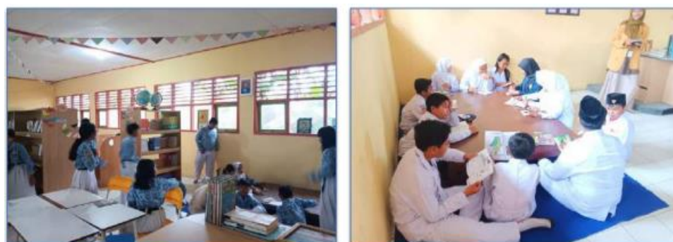
Gambar 2. Gerakan membaca 15 menit sebelum KBM