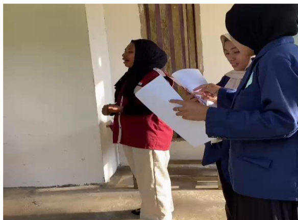
Gambar 1. penyampaian materi terkait Hipertensi

Informasi yang didapatkan dari penyuluhan dapat memberikan pengaruh jangka pendek sehingga dapat menghasilkan perubahan atau peningkatan pengetahuan (Hamzah et al., 2022) (Fuad, 2019). Sasarannya baik pada Masyarakat umum maupun khusus pada kelompok lansia, karena lansia juga merupakan kelompok yang rentan terkena hipertensi (Istichomah, 2020), selain penyuluhan kesehatan agar meningkatkan pemahaman dapat juga dilakukan pemeriksaan cek kesehatan secara gratis yang dilakukan oleh layanan kesehatan bekerjasama dengan beberapa instansi atau Lembaga untuk mengetahui secara dini status kesehatan Masyarakat (Lestari & Al, 2023) Program ini merupakan program rutin yang dilakukan disetiap layanan Kesehatan.