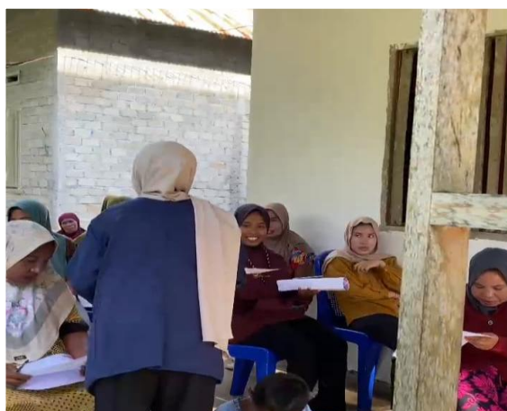
Gambar 3. Pembagian Kuesioner Pre-test