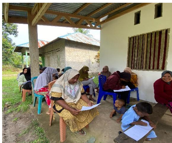
Gambar 2. Peserta Penyuluhan