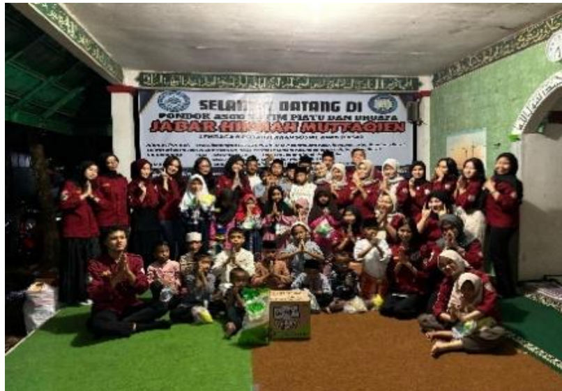
Gambar 1. Kegiatan Penyuluhan

Dalam sistem hukum Indonesia, perlakuan terhadap anak yang terlibat dalam tindakan pencurian dan bullying berbeda dengan perlakuan terhadap orang dewasa. Anak-anak yang melakukan tindak pidana, termasuk pencurian, tidak akan dijatuhi hukuman penjara yang sama seperti orang dewasa. Sistem hukum pidana anak lebih mengutamakan pendekatan rehabilitatif dan edukatif, yang bertujuan untuk membantu anak memahami kesalahan mereka dan memperbaiki perilaku mereka ke depan.