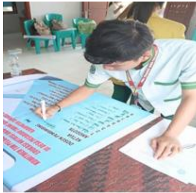
Ketua PKK Ormawa Hima Kesmas Mentanda tangani Mitra Kerja Sama.