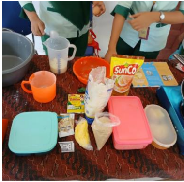
Bahan-bahan yang digunakan untuk pembuatan olahan pangan lokal ubi kayu