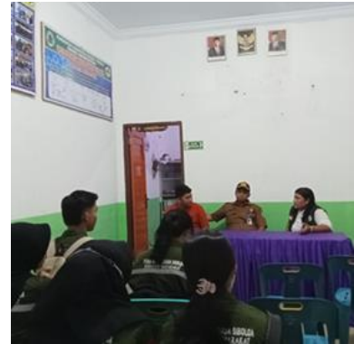
Diskusi Bersama Kepala Puskesmas Dan Kepala Desa Pasaribu Tobing Mengenai Stunting Pada Anak Remaja yang ada di Pasaribu Tobing