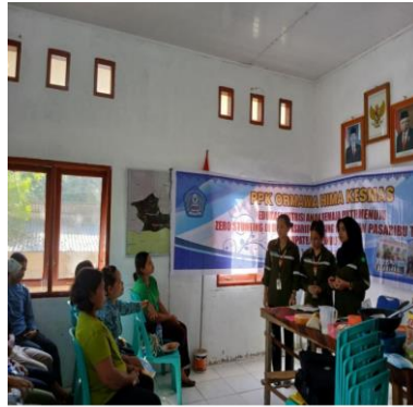
Memberikan materi serta pelatihan pengolahan pangan lokal kepada ibu PKK