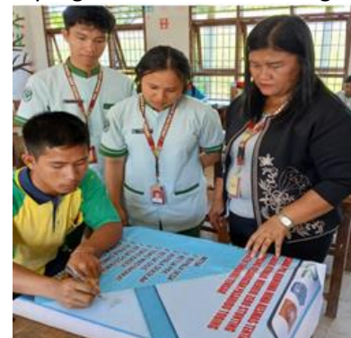
Ketua Osis SMA Negeri 1 Pasaribu Tobing Mentanda Tangani Mitra Kerja sama.