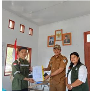
Menyerahkan Mitra Kerja Kepada Kepala Desa Pasaribu Tobing