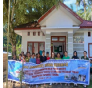
Foto bersama dengan ibu Pkk dan tokoh masyarakat di balai desa pasaribu tobing