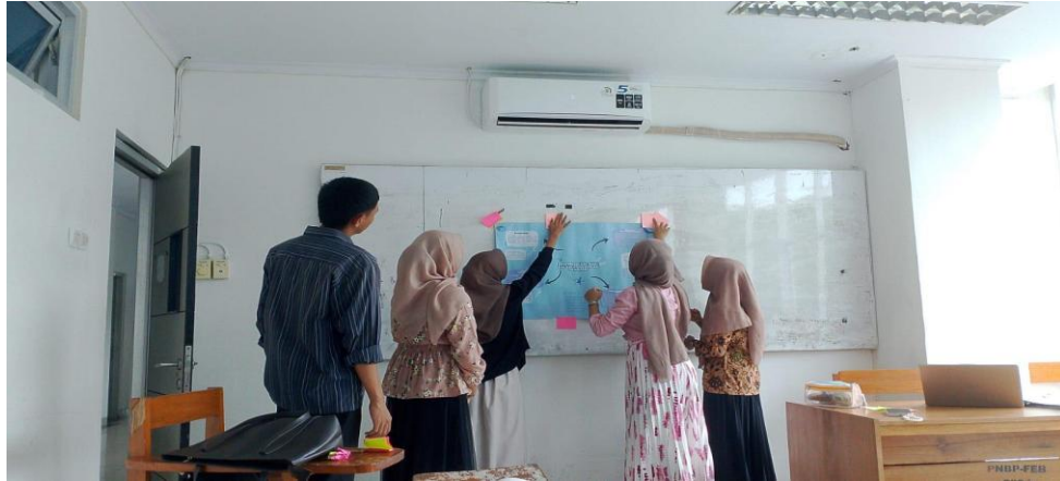
Gambar 1: Observasi Presentasi Mahasiswa dalam Komunikasi Akademik

Indonesia oleh para mahasiswa dalam komunikasi akademik. Observasi dilakukan selama presentasi di kelas, diskusi kelompok, serta dalam konteks komunikasi akademik para mahasiswa selama kegiatan perkuliahan berlangsung.