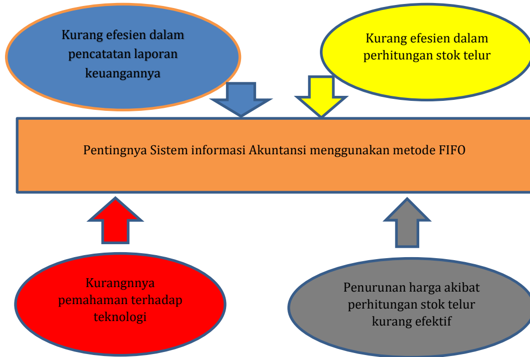
Gambar 2. Model Hubungan antara makna dan tema