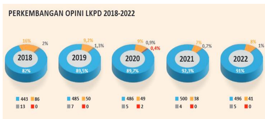
Gambar 1 Perkembangan Opini LKPD 2018-2022

Menurut Undang-Undang No. 15 Tahun 2004, hasil audit adalah opini yang menyatakan kualitas laporan keuangan berdasarkan kewajaran informasi yang disajikan. Opini yang diberikan terdiri dari Wajar Tanpa Pengecualian (WTP), Wajar Dengan Pengecualian (WDP), Tidak Wajar (TW), dan Tidak Memberikan Pendapat (TMP), sesuai dengan Peraturan BPK No. 1 Tahun 2017. Pemerintah daerah harus memperhatikan empat komponen utama dalam pengelolaan keuangan: kesesuaian laporan keuangan dengan standar pemerintah, kecukupan pengungkapan, kepatuhan terhadap hukum, dan efektivitas sistem pengendalian intern. Diagram berikut menunjukkan perkembangan opini BPK terhadap laporan keuangan pemerintah daerah dari 2018 hingga 2022.