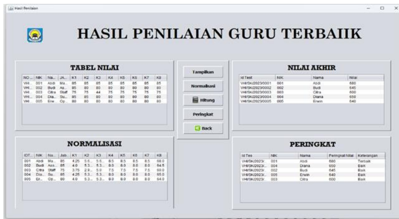
Gambar 4. Menu Perhitungan

Halaman nilai bobot kriteria, pada halaman ini admin dapat mengubah nilai bobot dan mengelola nilai kriteria guru, nilai-nilai ini yang nantinya akan dilakukan perhitungan. Admin dapat memasukan data sesuai kebutuhan, gambar diatas admin memasukan 8 data sesuai dengan perhitungan algoritma diatas.