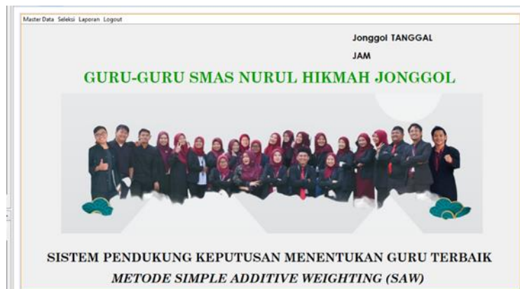
Gambar 1. Menu Utama

Pada halaman menu utama ini admin ditampilkan 4 menu yang dimana admin dapat memulai perhitungan dengan memulai dari menu master dan memilih data guru.