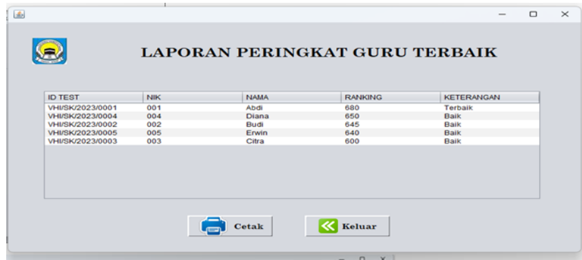
Gambar 5. Hasil Perhitungan

Halaman hasil, pada halaman ini admin ditampilkan laporan hasil peringkat guru terbaik