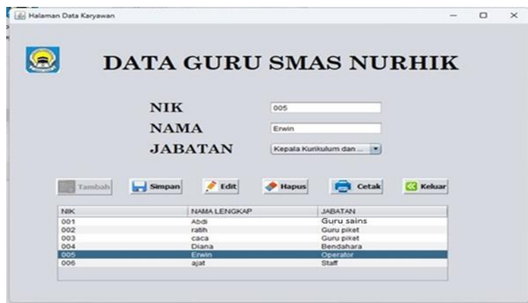
Gambar 2. Menu Data Guru

Pada halaman menu utama ini admin ditampilkan 4 menu yang dimana admin dapat memulai perhitungan dengan memulai dari menu master dan memilih data guru.