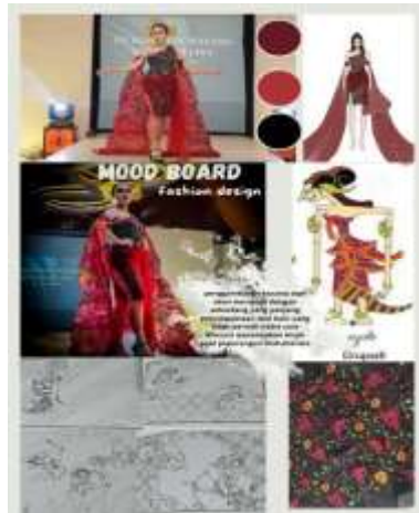
Gambar 3. Desain mood board durupadi

pola celana. Pada desain busana ini menggunakan seliuet I , yang bertujuan busana terlihat lebih tegas.