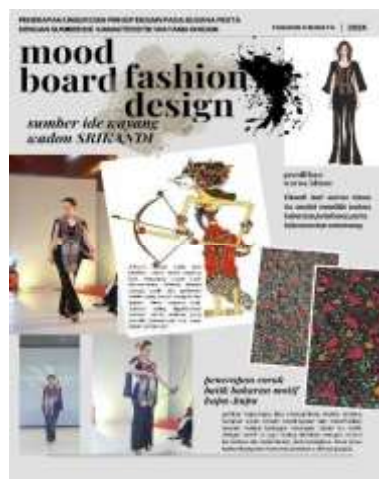
Gambar 2. Desain mood board Srikandi

Komunikasi Visual: mood board mempermudah desainer untuk berkomunikasi dengan tim atau klien, memastikan semua pihak memiliki pemahaman yang sama tentang konsep desain yang ingin diwujudkan.