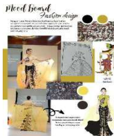
Gambar 4. Desain mood board Surtikanti

Desain busana pesta yang terinspirasi dari karakter Wayang Wadon Durupadi pada gambar 3. Desain busana yang di ciptakan merupakan busaan 1 pice. Desain dres yang di ripatakn memiliki seluet A, dress tanpa lengan dan Panjang dress di atas lutut dan memiliki bukaan resletingpada bagian sisi samping. Pemilihan bahan pada desain dress ini menggunakan kain katun full corak batik mbakaran dan pada bagian sambungan pinggan terdapat drapingan tile. Point of interest desain ini terdapat pada bagian lengan terpisah yang terbuat dari kain kaca sepanjang 2 meter dan di lukis gambar wayang seacra manual menggunakan cat akrilik dan glitter. Pemilihan warna merah untuk desain busana yang sederhana menciptakan karakter dari sumber ide itu sendiri, yaitu cantik, anggun, berani, dan tegas.