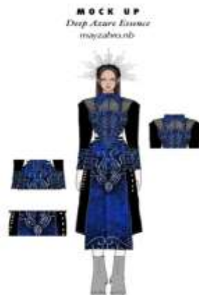
Gambar 2. Sketsa 1

Tahap pembuatan sketsa kerja ( mock up ) menghasilkan rancangan teknis busana bertema “ Deep Azure Essence ” yang disusun menggunakan aplikasi IbisPaint sebagai panduan konstruksi.