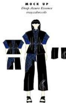
Gambar 3. Sketsa 2

Sketsa pertama pada Gambar 2 berupa setelan atasan jaket/vest dan rok panjang sebagai statement piece yang menginterpretasikan Legenda Putri Junjung Buih melalui perpaduan kain Sasirangan biru tua dan material hitam berstruktur. Warna biru tua merepresentasikan elemen air sebagai asal kelahiran sang putri, sedangkan hitam menghadirkan kesan formal dan kemuliaan kerajaan. Motif celup bintang putih atau perak pada Sasirangan memvisualisasikan buih dan riak air. Motif Ombak Sinampur Karang ditempatkan sebagai fokus utama pada panel atasan dan rok. Siluet atasan yang terstruktur dengan kerah lebar dan ritsleting melambangkan kekuatan dan kewibawaan