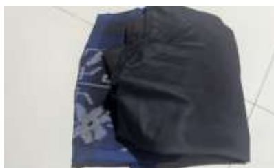
Gambar 5. Proses pemetaan bahan sebelum dilakukan pemotongan