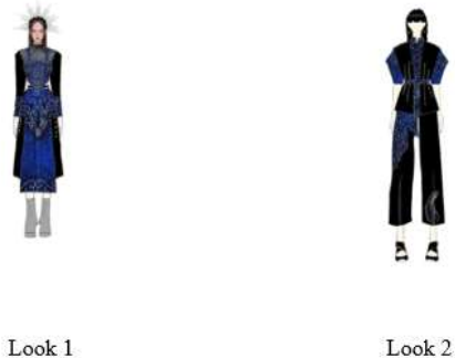
Gambar 4. Detail proses pewarnaan digital dan penentuan skema warna Deep Azure

Proses perancangan busana dilakukan menggunakan teknologi digital untuk memperoleh presisi warna dan visualisasi tekstur yang lebih akurat. Tahap awal dimulai dengan pembuatan atau pengimporan proporsi tubuh manusia sebagai dasar desain. Selanjutnya, rancangan dibagi ke dalam beberapa lapisan (layer), dengan layer dasar digunakan untuk membangun siluet busana hitam dan layer atas untuk penempatan motif Sasirangan. Pemanfaatan fitur brush dan pengaturan opacity pada aplikasi IbisPaint X digunakan untuk menyimulasikan kilau kain serta detail motif Ombak Sinampur Karang secara realistis, sehingga visual desain dapat dievaluasi secara optimal sebelum masuk ke tahap produksi dan penjahitan.