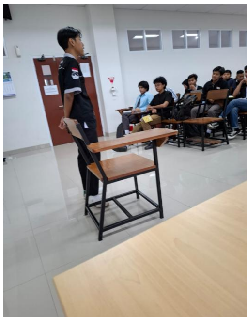
Gambar 1. Dokumentasi