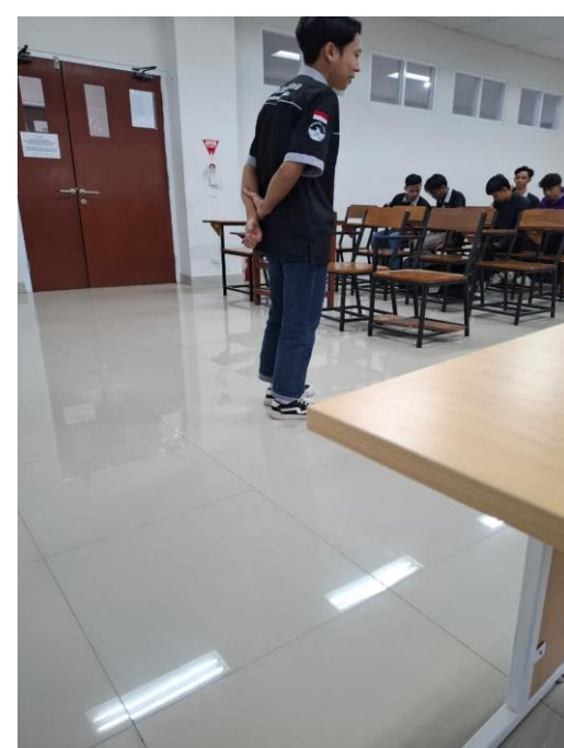
Gambar 4. Dokumentasi