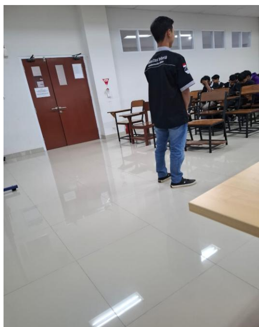
Gambar 2. Dokumentasi