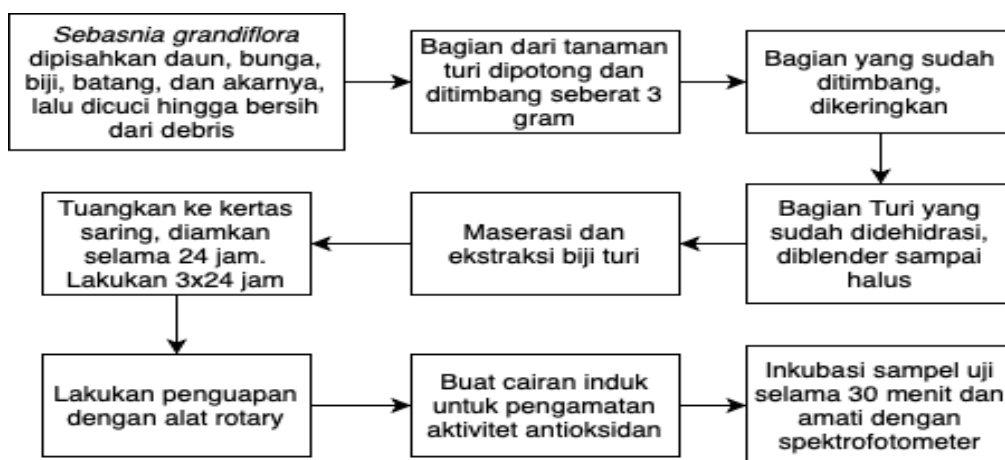
Gambar 1. Alur Ekstraksi Biji Turi

juga dapat dilakukan dengan menjemur bagian tanaman turi sembari ditutup menggunakan kain hitam dibawah sinar matahari semal 23 - 72 jam.