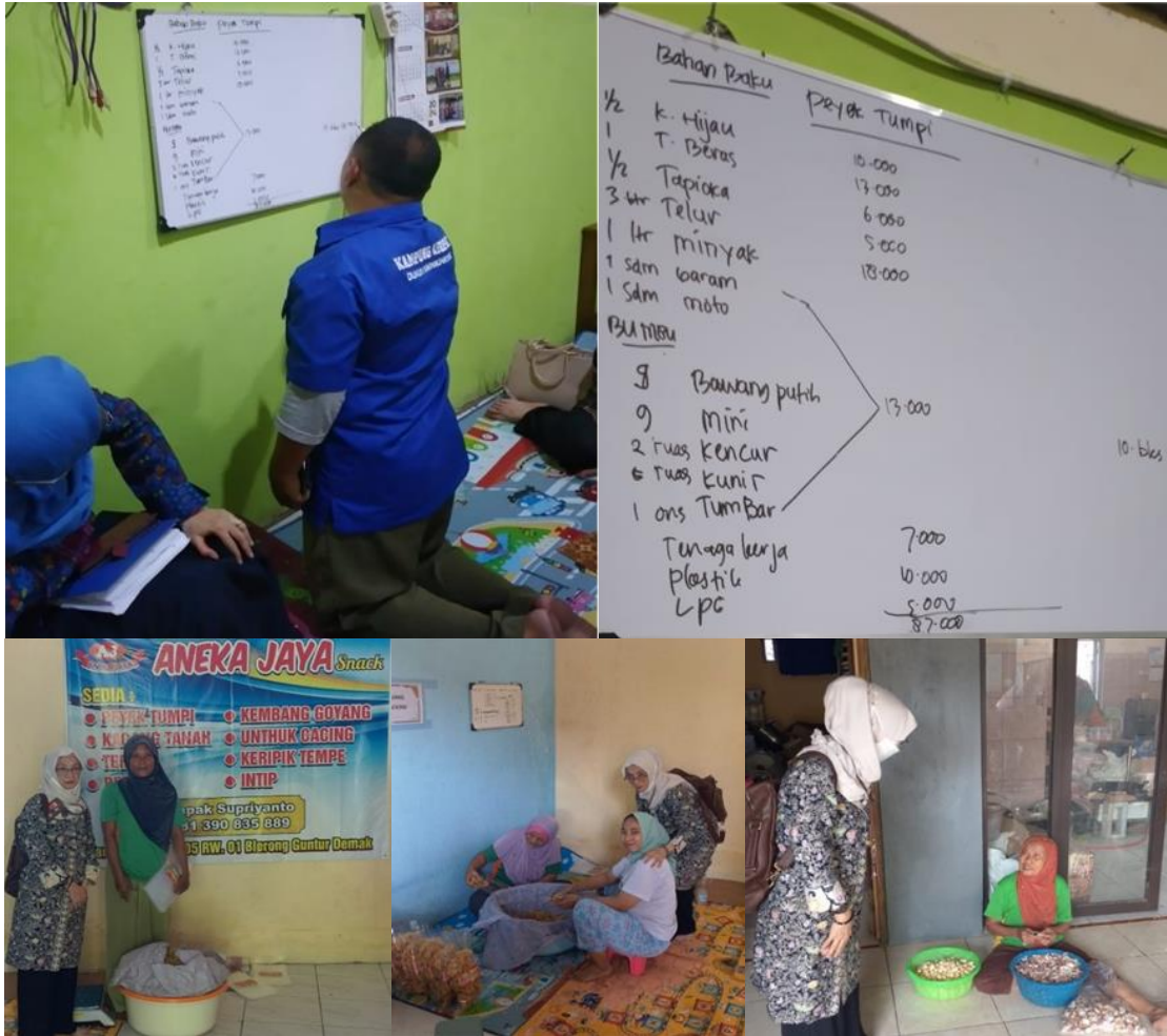
Gambar 3. Pecarian Kebuthan UMKM