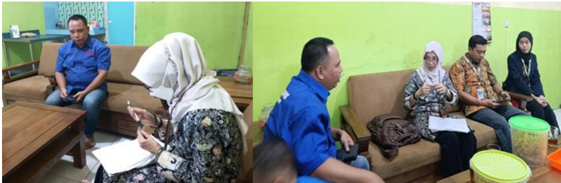
Gambar 1. Pecarian Kebuthan UMKM