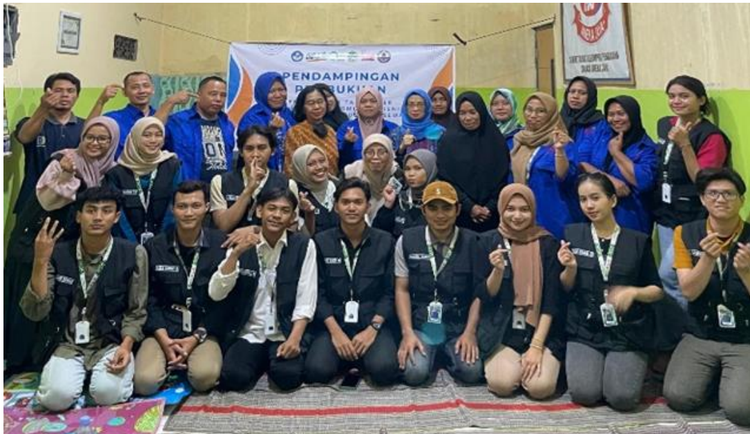
Gambar 2. Pelaksanaan Pelatihan