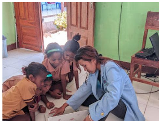
Gambar 2. Pelatihan Microsoft Power Point pada kelas 1-6