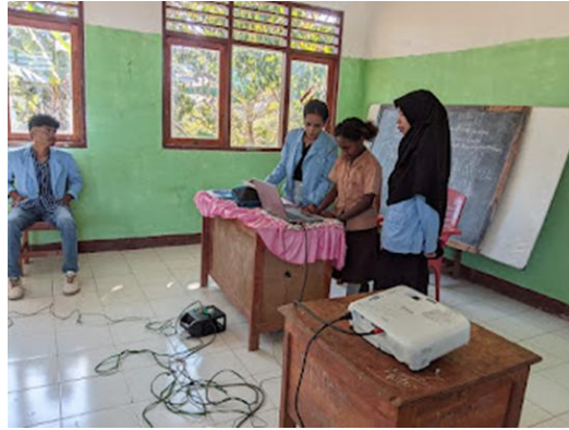
Gambar 1. Pelatihan Microsoft Power Point pada kelas 1-6