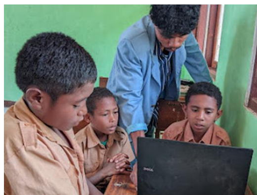
Gambar 3. Pelatihan Microsoft Power Point pada kelas 1-6