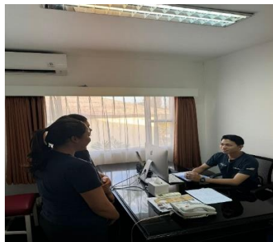
Gambar 3. Mensosialisasikan kepada karyawan tentang pemahaman pentingnya kearsipan dan pencatatan melalui media hardware dan software dengan kemajuan teknologi.

Program kerja kedua dalam kegiatan ini adalah pelatihan sistem pencatatan, form absensi, dan inventory secara sederhana dengan Google Sheet, dengan realisasi ketercapaian mencapai 100%. Berikut disajikan dokumentasi pelatihan sistem pencatatan, form absensi, dan inventory secara sederhana dengan Google Sheet.