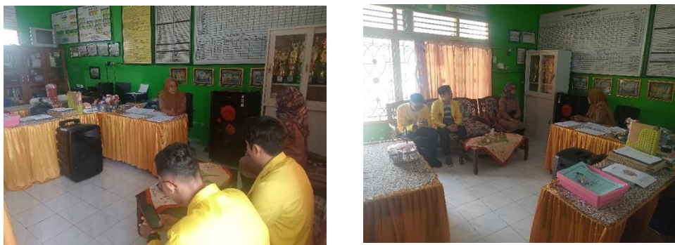
Gambar 2: Tahapan Observasi dan Koordinasi

Untuk lebih jelasnya berikut ini digambarkan alur metode pelaksanaan kegiatan: