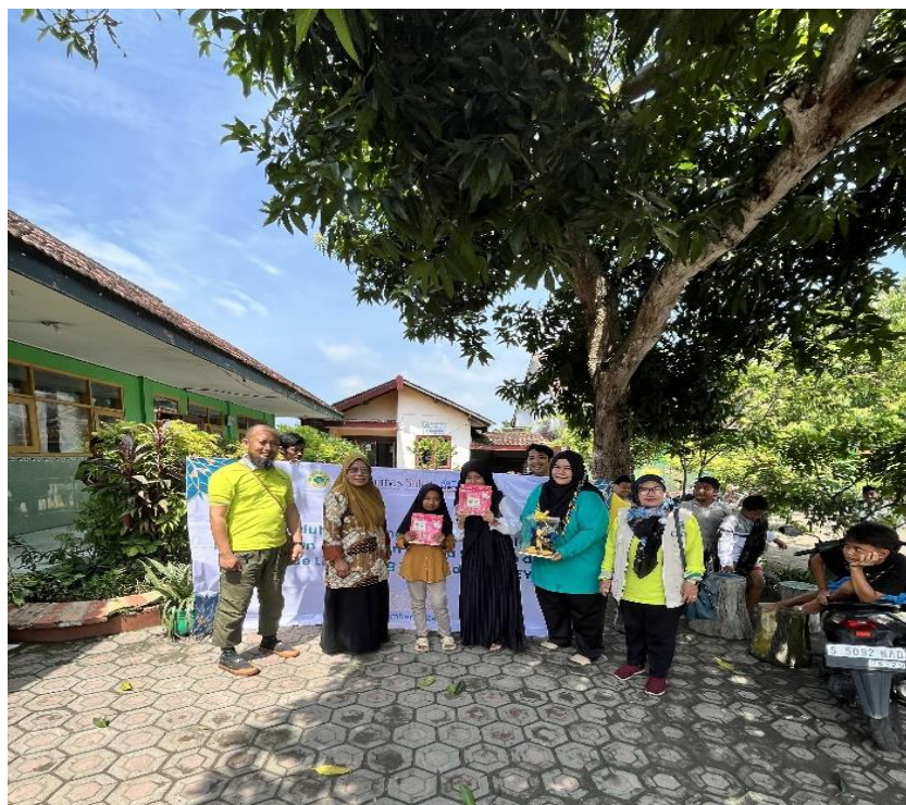
Gambar 6 : Penyerahan hadiah mini games