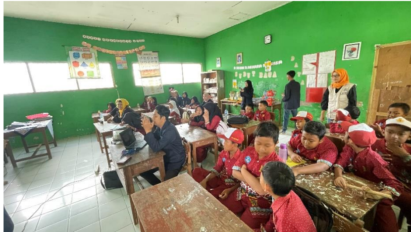
Gambar 5: Tahapan Sosialisasi