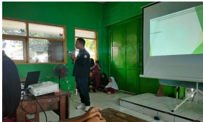
Gambar 4 : Narasumber menyampaikan informasi