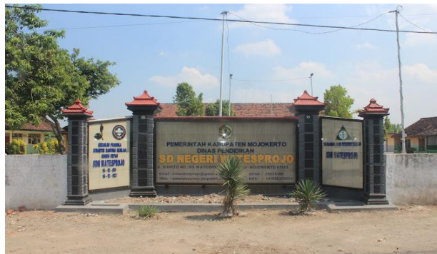
Gambar 1: SDN Watesprojo Desa Watesprojo