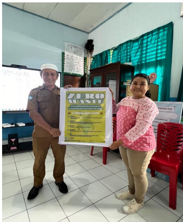
Gambar 3 : Pernyerahan poster kegiatan Pengabdian Kepada Masyarakat kepada Bapak Kepala Sekolah SMA Negeri 3 Kota Ternate.