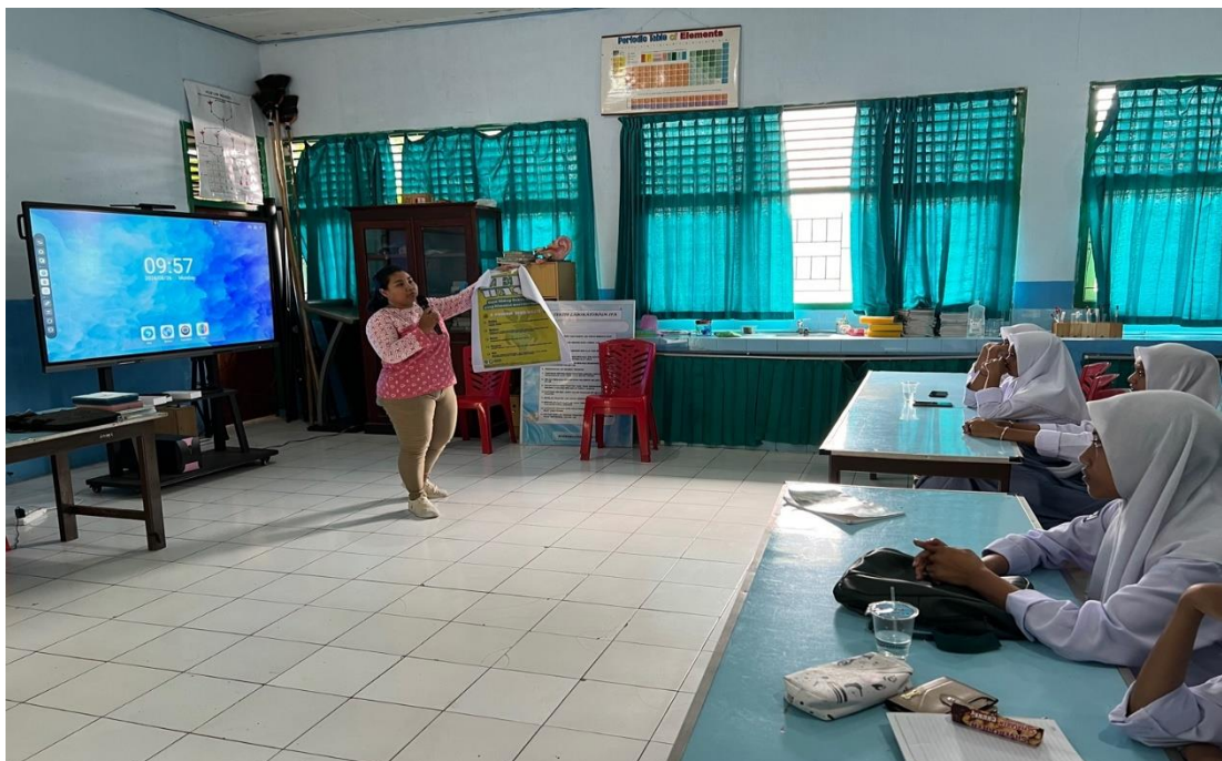
Gambar 5 : Proses sosialisasi dan interaksi mengenai ZERO WASTE dengan para siswa kelas 10 SMA Negeri 3 Kota Ternate di Ruang Laboratorium.