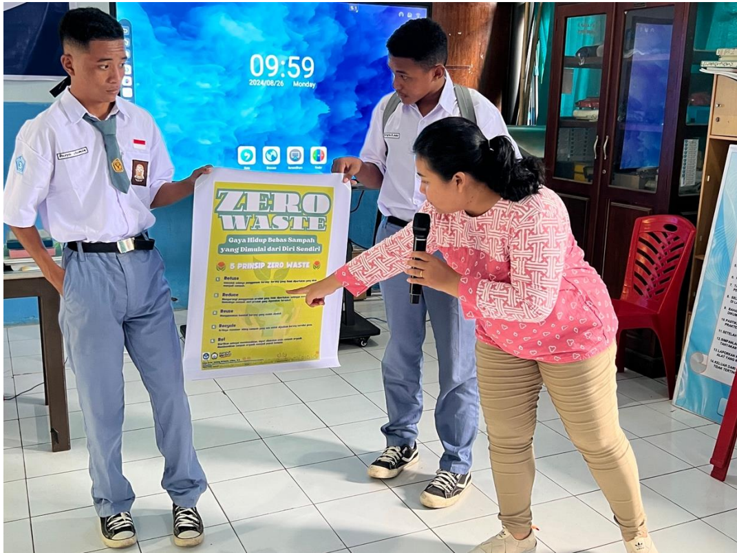
Gambar 4 : Proses sosialisasi dan interaksi mengenai ZERO WASTE dengan para siswa kelas 10 SMA Negeri 3 Kota Ternate di Ruang Laboratorium.