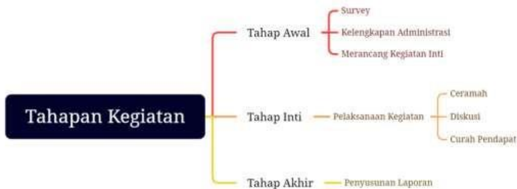
Gambar 1. Tahapan Kegiatan

Adapun kegiatan ini diikuti oleh 1 orang kepala desa dan 10 orang perangkat desa, dimana pelaksanaan kegiatan dilakukan selama 3 hari efektif di Balai Desa Bioa Sengok Kecamatan Rimbo Pengadang Kabupaten Lebong.