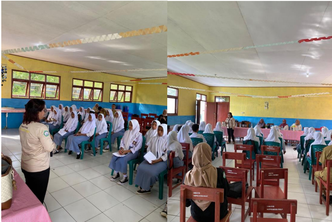
Gambar 1. Pemaparan Topik Sadar Wisata