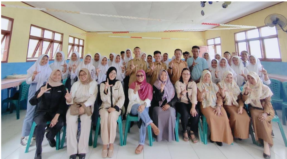
Gambar 3. Foto Bersama Tim dan Peserta

Pada sesi kuis akhir, semua siswa dapat menyebutkan ketujuh elemen sapta pesona. Secara keseluruhan, dapat disimpulkan bahwa semua siswa yang mengikuti sosialisasi dapat dengan baik memahami sosialisasi sadar wisata yang baru saja mereka ikuti.