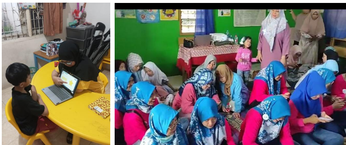
Gambar 2: Pelatihan Pengenalan Jenis Terapi Bagi Orang Tua Dengan Metode Multimedia di Kazama