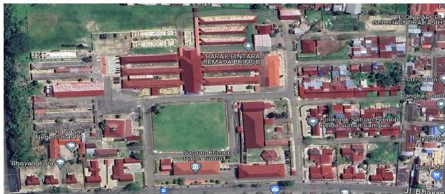
Gambar 1: Lokasi Pengabdian

Pelaksanaan proyek proyek di kota Medan sangat banyak, dan salah satunya pelaksanaan pembangunan rumah susun di POLDA Lokasi kegiatan ini berada di JL. Bhayangkara Kel. Indra Kasih Kec. Medan Tembung, Kota Medan - Prov. Sumatera Utara.