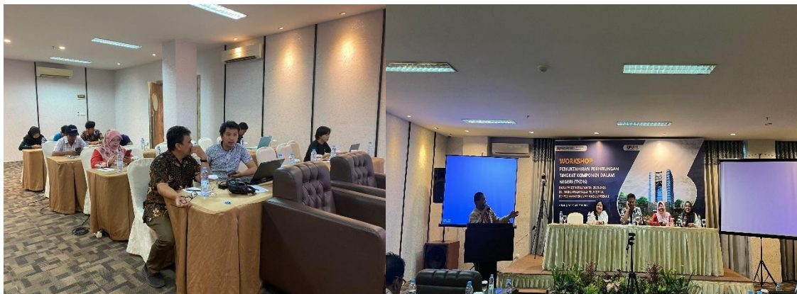
Gambar 5. Pelaksanaan Pengabdian Masyarakat