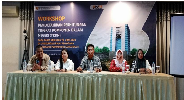
Gambar 3. Peserta Pengabdian