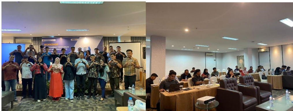
Gambar 4. Peserta Pengabdian