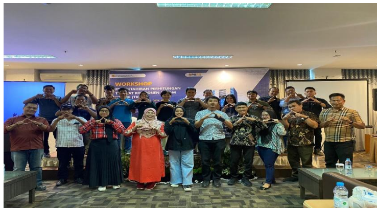
Gambar 2. Pelaksanaan Pengabdian Masyarakat

Didalam pelaksanaan pekerjaan proyek tersebut TKDN sangatlah penting, untuk itu diadakan sosialisasi. Hal ini sangat penting, mengingat karakteristik TKDN untuk barang adalah capaian TKDN yang menunjukkan pada satu jenis barang(digunakan untuk pengadaan produk tunggal). Sedangkan untuk jasa capaian TKDN yang menunjuk pada satu kontrak pekerjaan jasa (digunakan untuk pengadaan jasa). Karakteristik TKDN untuk jasa pemborongan (gabungan barang dan jasa) adalah capaian TKDN yang menunjuk pada satu kontrak pekerjaan jasa pemborongan ( digunakan untuk pengadaan multi produk atau gabungan barang dan jasa)