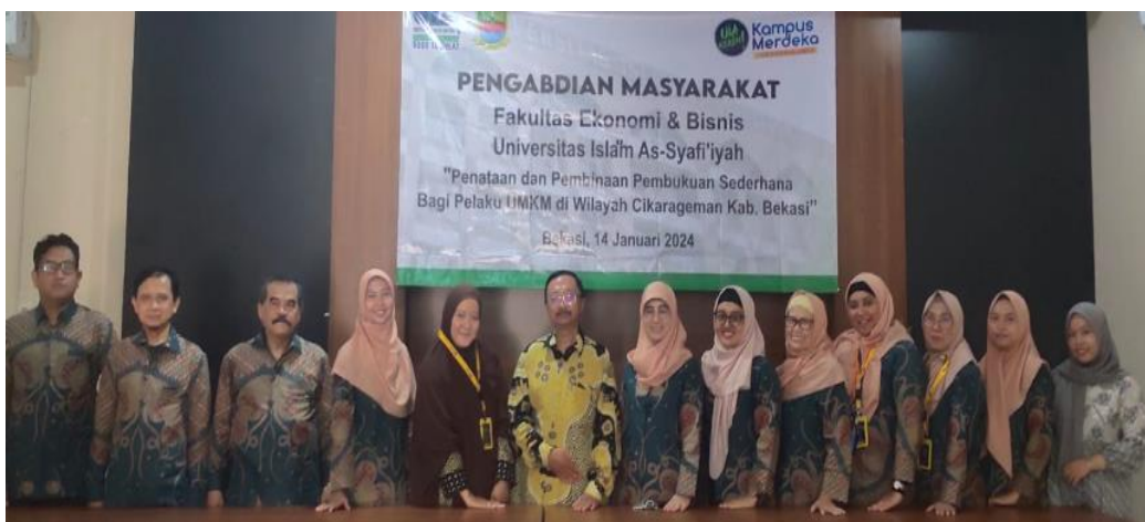
Foto Peserta Pengabdian Masyarakat