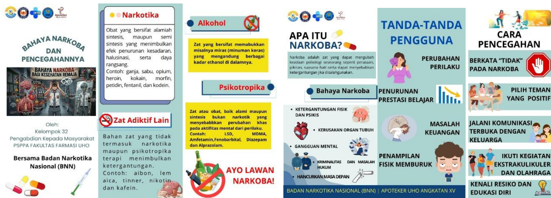
Gambar 2. Leaflet edukasi narkoba

Penyampaian materi oleh narasumber menggunakan metode asosiasi yaitu menyampaikan materi berdasarkan fakta dan kejadian di lapangan serta contoh-contoh kasus penyalahgunaan narkoba yang sudah terjadi. Metode asosiasi yang digunakan dalam penyampaian materi dinilai efektif terhadap peningkatan wawasan dan pengetahuan peserta mengenai bahaya penyalahgunaan narkoba. Dalam proses pemberian materi, juga dilakukan simulasi pencegahan penyalahgunaan narkoba di pada siswa sehingga siswa menjadi lebih paham tidak hanya secara teori tetapi juga praktik pencegahan penyalahgunaan narkoba.