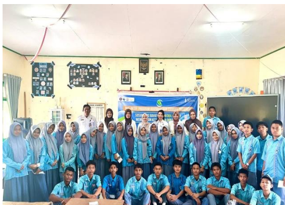
Gambar 3. Dokumentasi Kegiatan

Setelah pemberian materi oleh narasumber maka peserta diberikan kesempatan untuk bertanya dan melakukan diskusi pada sesi tanya jawab. Peserta sangat antusias dalam bertanya kepada narasumber mengenai bahaya, dampak dan cara pencegahan penyalahgunaan narkoba. Antusiasme siswa juga semakin meningkat karena para peserta aktif diberikan bingkisan hadiah sebagai bentuk apresiasi. Setelah sesi tanya jawab selesai maka kegiatan selanjutnya adalah pengisian kuesioner akhir ( post-test ) untuk mengukur pengaruh sosialisasi terhadap peningkatan pengetahuan dan ketahanan diri siswa. Sesi terakhir adalah foto bersama antara peserta, narasumber dan penyelenggara. Berikut dokumentasi foto bersama pada Gambar 3 dan Gambar 4 .