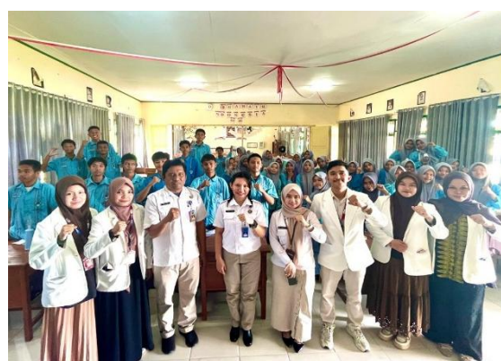
Gambar 4. Dokumentasi Kegiatan

Keberhasilan kegiatan kemudian dievaluasi menggunakan analisis kuantitatif komparasi pre-test dan post-test . Adapun data hasil pre-test dan post-test peserta dapat dilihat pada Tabel 1 .