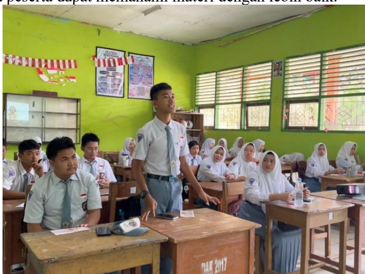
Gambar 3. Sesi Tanya Jawab

Setelah penyampaian materi selesai, kegiatan dilanjutkan dengan sesi diskusi dan tanya jawab. Pada sesi ini peserta menunjukkan antusiasme yang tinggi dengan mengajukan berbagai pertanyaan mengenai penggunaan skincare, pemilihan produk yang sesuai dengan jenis kulit, serta cara membedakan produk yang aman dan berbahaya. Diskusi berlangsung secara interaktif sehingga peserta dapat memahami materi dengan lebih baik.