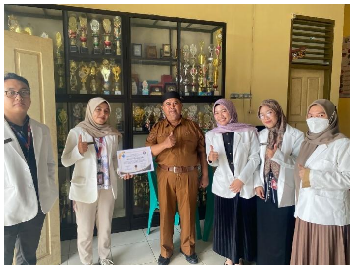
Gambar 4. Pemberian Sertifikat Apresiasi

Sebagai bentuk apresiasi dan ucapan terima kasih atas dukungan dalam pelaksanaan kegiatan pengabdian kepada masyarakat, tim pelaksana menyerahkan sertifikat apresiasi kepada pihak SMA Negeri 5 Kendari. Penyerahan sertifikat ini diharapkan dapat mempererat kerja sama antara Fakultas Farmasi Universitas Halu Oleo dan SMA Negeri 5 Kendari dalam pelaksanaan kegiatan edukasi kesehatan di masa mendatang.