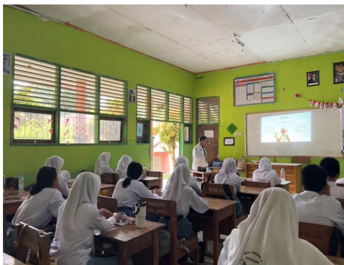
Gambar 2. Penyampaian Materi di Ruang Kelas SMA Negeri 5 Kendari

Setelah penyampaian materi selesai, kegiatan dilanjutkan dengan sesi diskusi dan tanya jawab. Pada sesi ini peserta menunjukkan antusiasme yang tinggi dengan mengajukan berbagai pertanyaan mengenai penggunaan skincare, pemilihan produk yang sesuai dengan jenis kulit, serta cara membedakan produk yang aman dan berbahaya. Diskusi berlangsung secara interaktif sehingga peserta dapat memahami materi dengan lebih baik.