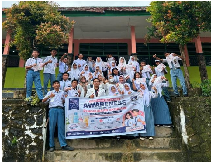
Gambar 5. Foto bersama Siswa Siswi SMA Negeri 5 Kendari

Secara keseluruhan, kegiatan pengabdian kepada masyarakat ini berjalan dengan lancar dan mendapatkan respons yang positif dari peserta. Melalui kegiatan edukasi yang telah dilaksanakan, siswa-siswi SMA Negeri 5 Kendari memperoleh pengetahuan dan pemahaman yang lebih baik mengenai tren skincare, cara memilih skincare dan kosmetik yang aman, serta mengenali ciri-ciri produk yang aman dan berbahaya. Diharapkan pengetahuan yang diperoleh dapat diterapkan dalam kehidupan sehari-hari sehingga siswa menjadi lebih bijak, kritis, dan selektif dalam memilih produk skincare maupun kosmetik.