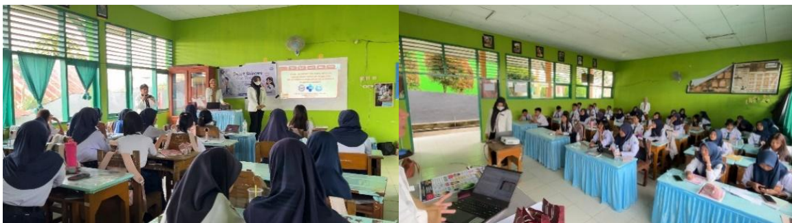
Gambar 2. Penyampaian Materi Tentang Skincare

Materi yang diberikan meliputi pengertian skincare , pentingnya penggunaan basic skincare pada remaja, kesalahan yang sering dilakukan dalam penggunaan skincare , pengenalan BPOM, bahaya produk non-BPOM, cara mengenali ciri-ciri skincare berbahaya, cara melakukan pengecekan nomor registrasi BPOM, tips memilih skincare yang aman, serta penerapan pola hidup sehat untuk menjaga kesehatan kulit. Edukasi ini diberikan karena saat ini banyak remaja mulai menggunakan berbagai produk skincare yang sedang viral di media sosial tanpa mempertimbangkan keamanan dan legalitas produk tersebut.