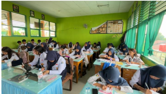
Gambar 1. Sesi Pre-test

Kegiatan diawali dengan pemberian pre-test untuk mengetahui tingkat pengetahuan awal peserta terkait basic skincare , keamanan kosmetik, serta risiko penggunaan produk non-BPOM. Hasil pre-test menunjukkan nilai rata-rata sebesar 77,64%, yang mengindikasikan bahwa sebagian peserta telah memiliki pengetahuan dasar mengenai perawatan kulit, namun masih terdapat beberapa kesalahan pemahaman terkait pemilihan dan penggunaan produk skincare yang aman. Setelah itu, peserta diberikan edukasi melalui penyampaian materi dan diskusi interaktif.