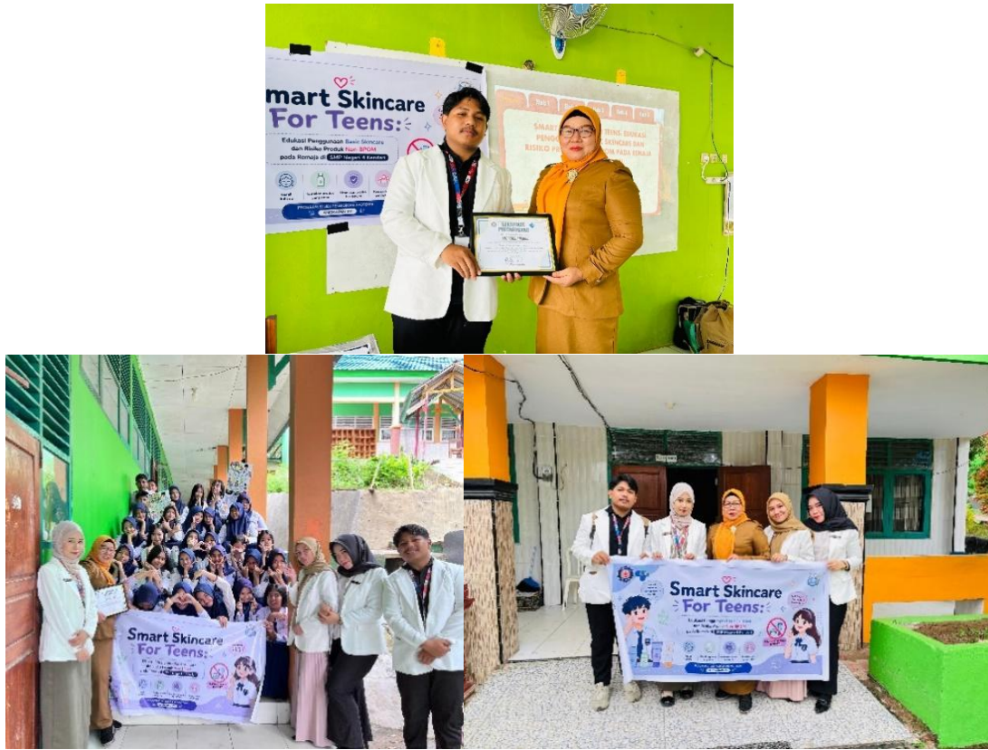
Gambar 5. Sesi Foto Bersama

Secara keseluruhan, kegiatan edukasi Smart Skincare For Teens berhasil meningkatkan pengetahuan dan kesadaran siswa SMPN 4 Kendari mengenai pentingnya penggunaan skincare yang aman, khususnya produk yang telah terdaftar di BPOM. Diharapkan pengetahuan yang diperoleh dapat diterapkan dalam kehidupan sehari-hari sehingga peserta lebih bijak dalam memilih produk perawatan kulit, terhindar dari penggunaan kosmetik berbahaya, serta mampu menjaga kesehatan kulit sejak usia remaja.