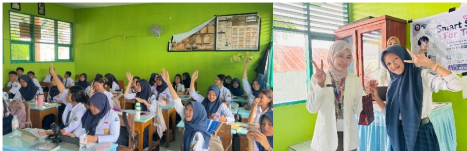
Gambar 3. Sesi Kuis dan pemberian hadiah

Sebagai bentuk evaluasi pemahaman peserta selama kegiatan berlangsung, tim pengabdian melaksanakan sesi kuis interaktif setelah penyampaian materi. Peserta yang mampu menjawab pertanyaan dengan benar memperoleh hadiah sebagai bentuk penghargaan atas partisipasi aktif mereka. Tingginya antusiasme peserta dalam mengikuti sesi ini menunjukkan bahwa materi yang disampaikan dapat dipahami dengan baik. Selain meningkatkan keterlibatan peserta, kegiatan kuis juga berperan dalam memperkuat pemahaman dan daya ingat peserta terhadap materi edukasi yang telah diberikan.