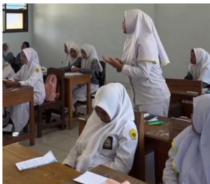
Gambar 2. Sesi tanya jawab

Materi yang dibawakan mengenai kosmetik, kandungan bahan kimia apa saja yang memberikan dampak berbahaya pada kulit seperti retinoid, hidrokuinolone, zat pewarna R10 dan cara pemilihan kosmetik yang aman berdasarkan himbauan Kepala Badan POM untuk selalu ingat mengecek “KLIK” sebelum membeli atau menggunakan kosmetika. Pemerintah telah menyediakan website resmi BPOM, media sosial resmi BPOM dan Halo BPOM 1500533 agar masyarakat dapat dengan mudah mendapatkan informasi tentang produk-produk kosmetika yang aman (Afianto & Qona’ah, 2019).