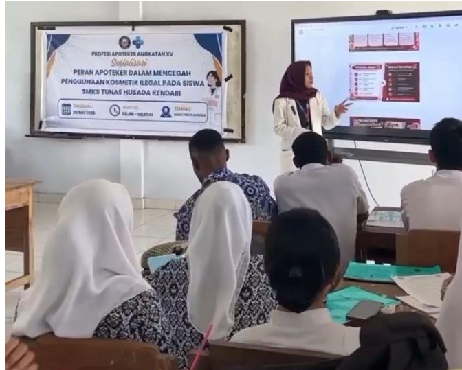
Gambar 1. Penyampaian Materi oleh mahasiswa Apoteker XV

materi dan pemberian leaflet sebagai media informasi yang dapat membrikan edukasi tentang pemilihan dan penggunaan produk kosmetika yang aman, dan dilanjutkan dengan himbauan untuk melakukan pengecekan “KLIK” (Kemasan, Label, Izin edar dan Kadaluarsa) pada produk kosmetik yang menjadi pilihan untuk digunakan.