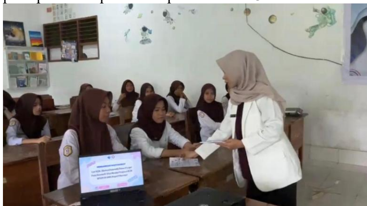
Gambar 3 Pembagian brosur kepada siswa siswi SMA Negeri 9 Kendari

Selama kegiatan berlangsung, terlihat adanya peningkatan partisipasi aktif dari siswa. Mereka menunjukkan rasa ingin tahu yang tinggi dengan mengajukan berbagai pertanyaan terkait kosmetik yang sedang viral, cara membedakan produk legal dan ilegal, serta dampak jangka panjang penggunaan kosmetik yang mengandung bahan berbahaya. Tingginya keterlibatan peserta ini menunjukkan bahwa edukasi yang diberikan mampu meningkatkan kesadaran dan minat remaja terhadap isu keamanan kosmetik (Suharsanti et al., 2025). Selain itu, penggunaan media edukasi berupa brosur di terapkan. Bentuk brosur dan pembagian brosur edukasi kepada peserta dapat dilihat pada Gambar 3 dan 4.