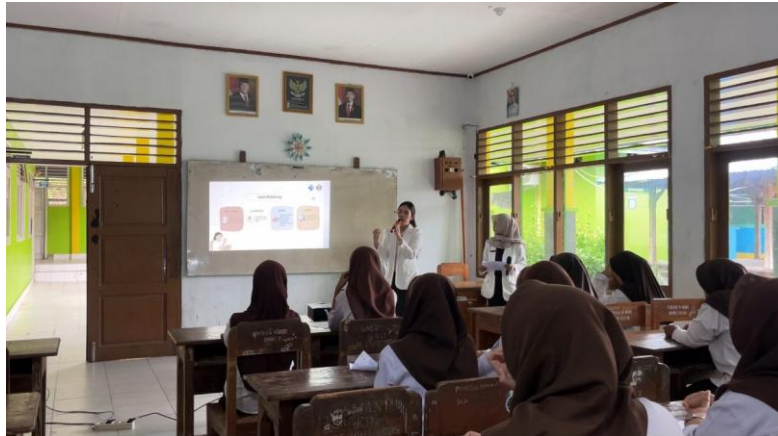
Gambar 2 Penyampaian Materi di Ruang Kelas SMA Negeri 9 Kendari

Pada tahap simulasi, siswa diberikan kesempatan untuk melakukan pengecekan langsung nomor registrasi kosmetik melalui BPOM Mobile. Kegiatan ini memberikan pengalaman belajar berbasis praktik yang memungkinkan siswa tidak hanya memahami teori, tetapi juga mampu mengaplikasikannya secara langsung. Pendekatan pembelajaran berbasis praktik ini terbukti lebih efektif dalam meningkatkan pemahaman karena memberikan pengalaman konkret kepada peserta (Suharsanti et al., 2025).