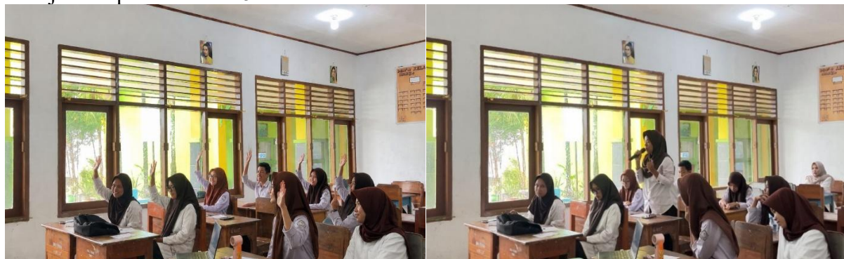
Gambar 5 Sesi Diskusi dan Tanya Jawab Bersama Peserta

Kegiatan dilanjutkan dengan sesi tanya jawab yang berlangsung secara interaktif. Peserta menunjukkan antusiasme yang tinggi dengan mengajukan berbagai pertanyaan terkait kosmetik viral yang banyak dipromosikan melalui media sosial, cara membedakan kosmetik legal dan ilegal, serta langkah-langkah yang harus dilakukan apabila menemukan produk yang dicurigai tidak memiliki izin edar. Antusiasme peserta selama sesi diskusi dan tanya jawab ditunjukkan pada Gambar 5.