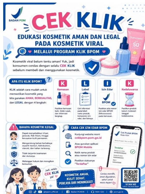
Gambar 4 bentuk brosur yang di bagikan kepada siswa siswi SMA Negeri 9 Kendari

Penggunaan media edukasi berupa brosur juga memberikan kontribusi penting dalam memperkuat pemahaman peserta. Brosur yang berisi panduan Cek KLIK dan langkah penggunaan BPOM Mobile berfungsi sebagai media pengingat yang dapat digunakan kembali setelah kegiatan selesai. Media cetak seperti ini terbukti efektif dalam mempertahankan informasi jangka panjang karena dapat dibaca berulang oleh peserta [6].