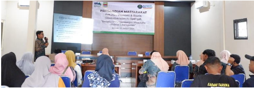
Documen pelatihan pelaku UMKM di balai desa Cikarageman