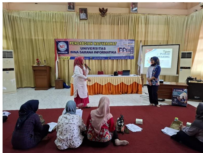
Gambar 8. Salah Satu Peserta Bertanya