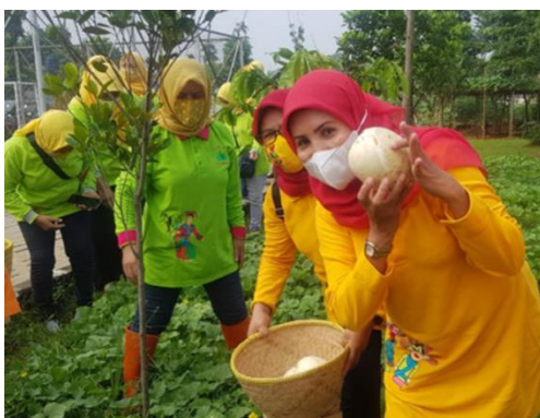
Gambar 4: Kegiatan PKK RW 006 Kelurahan Cibubur