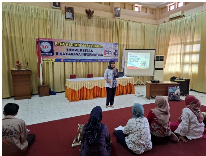
Gambar 7. TUTOR Menjelaskan Materi