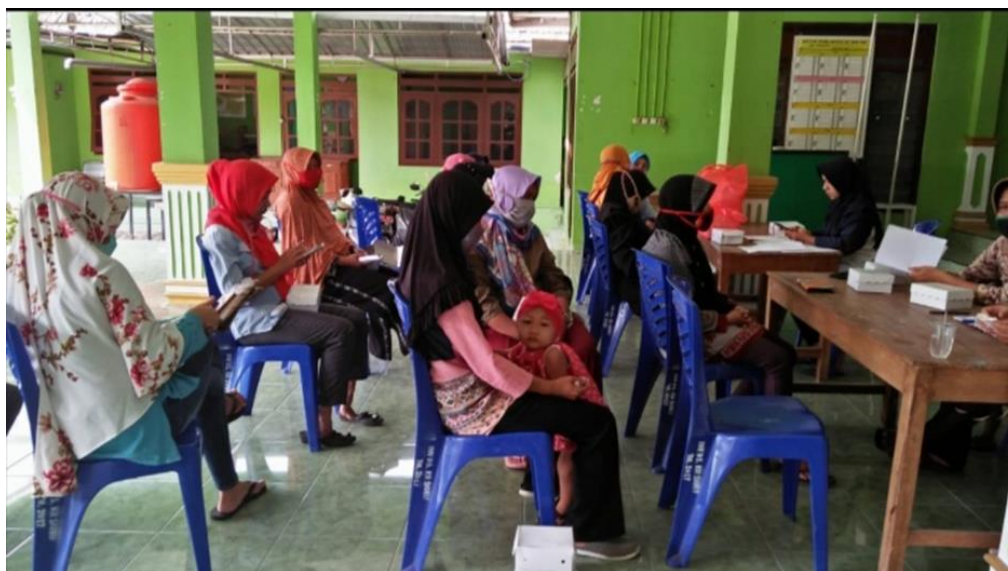
Gambar 5. Kegiatan Pendataan Warga Program Sembako Murah