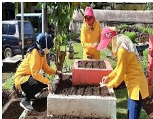
Gambar 2. PKK RW 006 Kelurahan Cibubur