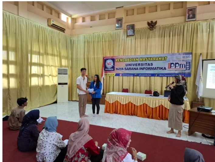
Gambar 10. Pemberian Hadiah Kepada yang Penanya Terbaik