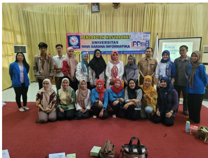
Gambar 11. Foto Bersama Dengan Peserta