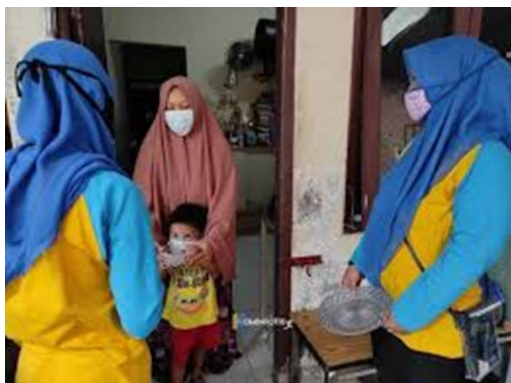
Gambar 1. Lokasi Kegiatan