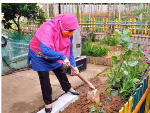
Gambar 3: Kegiatan PKK RW 006 Kelurahan Cibubur