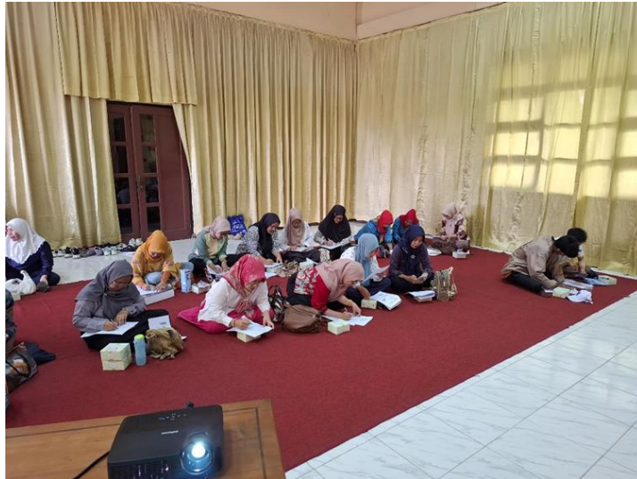
Gambar 9. Peserta Mengisi Kuesioner