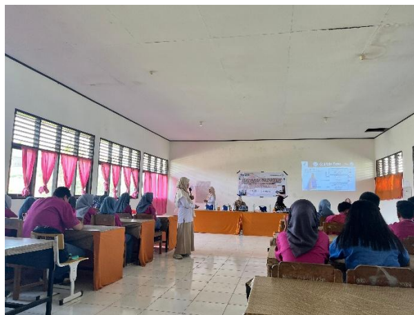
Gambar 2. Dokumentasi pemaparan materi oleh BPOM

Setelah sesi pre-test dilakukan, dilanjutkan dengan pemaparan materi oleh pihak BPOM. Materi yang dibawakan berupa penjelasan umum mengenai definisi kosmetik, jenis-jenis kosmetik, cara mengecek kosmetik yang telah teregistrasi oleh BPOM melalui aplikasi BPOM mobile , penerapan metode cek KLIK (Kemasan, Label, Izin edar dan Kadaluwarsa), contoh-contoh kosmetik ilegal, bahan berbahaya apa saja yang terkandung dalam kosmetik ilegal dan dampak yang ditimbulkan dari penggunaan kosmetik ilegal. Peserta terlihat bersemangat dengan materi yang disampaikan yang terlihat dari antusias siswa(i) untuk bertanya, mencatat materi yang diberikan dan mendengarkan pembawaan materi dengan tenang.