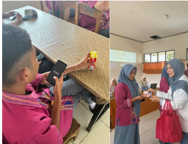
Gambar 3. Dokumentasi praktik cek produk teregistrasi menggunakan B POM mobile , cek KLIK dan penyerahan hadiah lomba quiz

Setelah pemaparan materi, selanjutnya dilakukan post-test berupa sesi tanya jawab untuk mengetahui sejauh mana pemahaman siswa(i) SMK Negeri 5 Kendari terhadap materi pemilihan kosmetik yang baik dan aman. Setelah sesi post-test dilakukan, dilanjutkan dengan sesi quiz untuk 3 siswa(i) tercepat yang dapat menjawab pertanyaan yang diberikan oleh mahasiswa Program Studi Profesi Apoteker Universitas Halu Oleo dan bagi siswa(i) yang dapat menjawab pertanyaan dengan benar diberikan hadiah sebagai bentuk apresiasi atas antusias yang luar biasa dari siswa(i) SMK Negeri 5 Kendari dalam kegiatan sosialisasi ini.