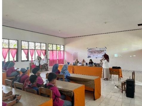
Gambar 1. Dokumentasi pembukaan kegiatan sosialisasi dan edukasi oleh mahasiswa PSPPA UHO

Setelah mendapat izin dari pihak sekolah maka kegiatan dilaksanakan. Pelaksanaan kegiatan pengabdian dimulai dengan moderator membuka kegiatan dengan menjelaskan tujuan mereka kepada siswa(i) SMK Negeri 5 Kendari dilanjutkan dengan sesi tanya jawab sebagai bentuk pre-test untuk melihat pengetahuan awal siswa(i) terkait kosmetik yang baik dan aman itu seperti apa.