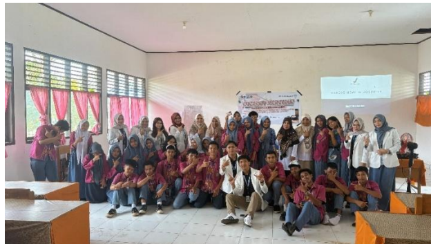
Gambar 4. Dokumentasi foto bersama siswa(i) SMK Negeri 5 Kendari, mahasiswa PSPPA UHO, pihak sekolah dan BPOM di Kota Kendari

Setelah pemaparan materi, selanjutnya dilakukan post-test berupa sesi tanya jawab untuk mengetahui sejauh mana pemahaman siswa(i) SMK Negeri 5 Kendari terhadap materi pemilihan kosmetik yang baik dan aman. Setelah sesi post-test dilakukan, dilanjutkan dengan sesi quiz untuk 3 siswa(i) tercepat yang dapat menjawab pertanyaan yang diberikan oleh mahasiswa Program Studi Profesi Apoteker Universitas Halu Oleo dan bagi siswa(i) yang dapat menjawab pertanyaan dengan benar diberikan hadiah sebagai bentuk apresiasi atas antusias yang luar biasa dari siswa(i) SMK Negeri 5 Kendari dalam kegiatan sosialisasi ini.