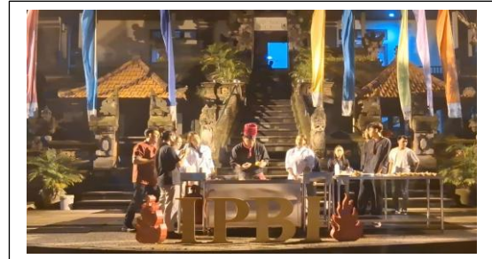
Gambar 2. Peserta pelatihan sedang memasak

Proses pembelajaran mampu menciptakan suasana belajar yang nyaman dan memungkinkan peserta untuk berinteraksi secara leluasa. Kegiatan dimulai dengan demonstrasi langsung oleh juru masak profesional, di mana peserta menyimak dengan penuh perhatian dan antusiasme. Selanjutnya, peserta diberikan kesempatan untuk praktik langsung sesuai dengan teknik yang telah diperagakan, yang secara signifikan meningkatkan keterlibatan dan pemahaman mereka. Pendekatan ini tidak hanya melatih keterampilan teknis, tetapi juga mengembangkan keterampilan interpersonal peserta yakni kemampuan berkomunikasi secara efektif baik secara verbal maupun nonverbal dalam hubungan antar individu atau kelompok. Keterampilan ini esensial karena manusia adalah makhluk sosial yang bergantung pada interaksi dan kolaborasi untuk mencapai tujuan bersama.