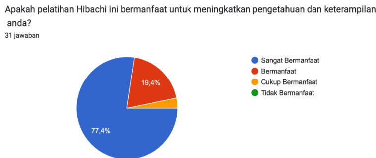
Gambar 5. Penilaian pada transfer knowledge

metode transfer pengetahuan dalam meningkatkan pemahaman dan keterampilan peserta. Agar Lebih jelas dapat lihat pada gambar 5.