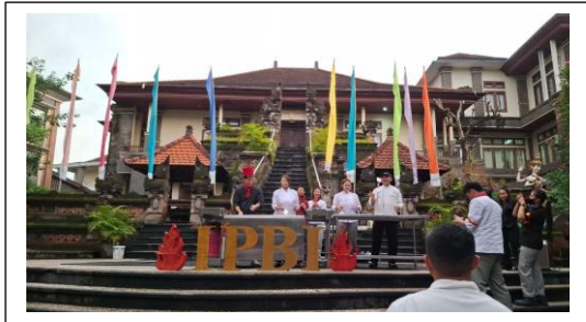
Gambar 1. Peserta pelatihan memainkan spatula

Lokasi pelatihan yang diselenggarakan di open stage kampus IPBI, dipilih secara strategis untuk memudahkan dalam menampung peserta dan membuat acara lebih menarik karena peserta dapat melihat proses pembelajaran hibachi. Model pelatihan ini mengedepankan metode learning by doing , di mana peserta tidak hanya memperoleh teori, tetapi juga terlibat aktif dalam proses pembuatan makanan secara langsung. Pendekatan ini diperkaya dengan sesi diskusi dan evaluasi yang memungkinkan peserta berbagi pengalaman, menyelesaikan kendala teknis, dan memperkuat pemahaman terhadap prinsip pengolahan makanan dengan teknik hibachi. Secara keseluruhan, model pelatihan dan pendampingan ini bertujuan untuk meningkatkan kompetensi, kreativitas dan inovasi dalam pengolahan makanan.