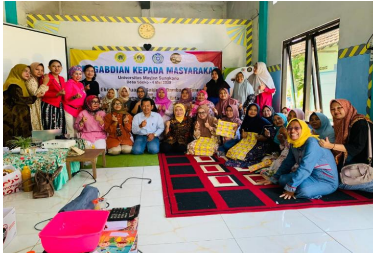
Gambar 3. Tahapan Penyerahan Hadiah untuk 3 Penanya Terbaik