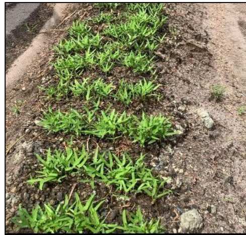
Gambar 7. Kangkung berumur 7 hari

Perbedaan pertumbuhan tanaman kangkung setelah diberi perlakuan penyiraman menggunakan larutan eco-enzym . Gambar 6 terlihat kondisi tanaman setelah 3 hari penyiraman rutin setiap pagi dan sore. Pertumbuhan yang tampak masih berada pada tahap awal, dengan jumlah daun sedikit dan ukuran batang yang relatif kecil. Meski demikian, terlihat bahwa kecambah sudah mulai tumbuh secara merata di lahan tanam.