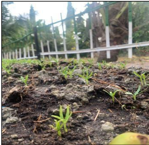
Gambar 6. Kangkung berumur 3 hari