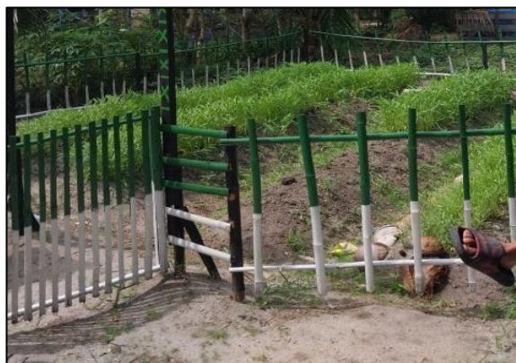
Gambar 8. Kangkung berumur 4 minggu

Perbedaan signifikan antara hasil penyiraman selama tiga hari dan satu minggu ini memperkuat temuan bahwa eco-enzym memiliki peran penting dalam mendukung pertumbuhan tanaman. Hal ini sejalan dengan penelitian (Maharmi, B., dkk., 2022) yang menyatakan bahwa kandungan mikroorganisme dalam eco-enzym berfungsi memperkaya unsur hara tanah sehingga proses penyerapan nutrisi oleh tanaman menjadi lebih efektif. Dengan demikian, implementasi eco-enzym dalam penyiraman kangkung secara rutin terbukti dapat mempercepat pertumbuhan tanaman dan meningkatkan kualitas hasil panen.