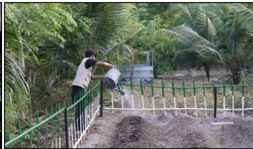
Gambar 3. Sosialisasi Eco-enzyme Gambar 4. Implementasi Eco-enzyme

Pengisian kuesioner melalui Google Form ini berjumlah 25 orang, yaitu warga yang hadir dalam seminar sosialisasi sesuai gambar 1. Seluruh partisipan diberikan kesempatan mengisi kuesioner melalui Google Form untuk mengetahui tingkat pemahaman, tanggapan, dan persepsi terhadap pengolahan sampah organik menjadi eco-enzyme serta pemanfaatannya sebagai pupuk kompos cair. Data kuisisioner ini digunakan untuk menilai efektivitas kegiatan sosialisasi dalam meningkatkan pengetahuan dan kesadaran masyarakat.