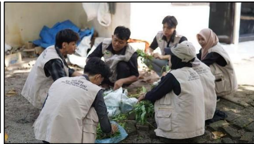
Gambar 1. Pengisian Google Form Gambar 2. Pemilihan bahan organik