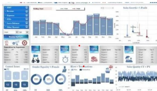
Gambar 2. Tampilan Dashboard Excel

Pada sesi pelatihan pembuatan Dashboard Microsoft Excel , setelah tahapan pengolahan data, selanjutnya mengolah data tersebut menjadi sebuah tampilan berbasis visual ( dashboard ). Hasil observasi menunjukkan bahwa siswa sangat antusias dalam pelaksanaan pelatihan tersebut. Salah satu bentuk dashboard tertuang pada gambar 2.