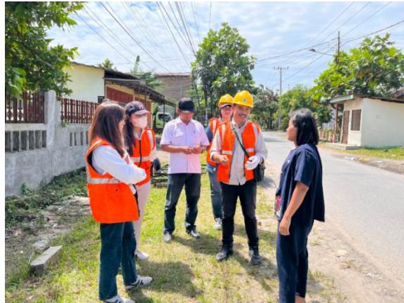
Gambar 4. Tahap Pelaksanaan: Sosialisasi Menjaga Kebersihan di Saluran