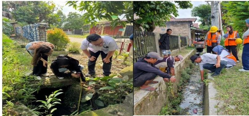
Gambar 2. Tahap Persiapan: Survey Awal Penentuan dan Pengukuran Titik Saluran

rumah warga, dengan jarak antar titik sekitar 700 meter. Pengukuran langsung di lapangan menunjukkan bahwa dimensi drainase pada Titik A adalah 70x90 cm, sedangkan pada Titik B adalah 60x60 cm. Berdasarkan data tersebut, tim merancang alat penangkap sampah yang terbuat dari besi tahan karat daur ulang. Material ini dipilih karena ekonomis, kokoh, dan memiliki daya tahan tinggi terhadap tekanan aliran air serta beban sampah. Besi tersebut dibentuk dengan celah yang ideal untuk menyaring sampah tanpa menghambat aliran air. Selanjutnya, dilakukan koordinasi dengan Kepala Lingkungan (Kepala Lingkungan ) untuk memperoleh dukungan dan izin pelaksanaan program. Edukasi awal juga diberikan kepada warga mengenai tujuan alat tersebut serta cara perawatannya setelah pemasangan.