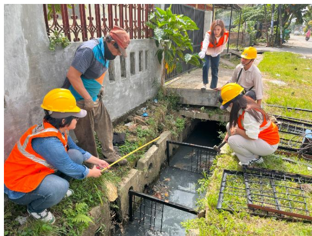
Gambar 3. Tahap Pelaksanaan: Pemasangan Alat Penangkap Sampah di Saluran

Tahap pelaksanaan mencakup pembuatan alat, proses pemasangan, dan sosialisasi kepada masyarakat. Alat penangkap sampah difabrikasi menggunakan besi daur ulang yang dicat ulang agar tahan korosi. Besi dipotong sesuai dimensi drainase dan disambung menggunakan kawat las untuk memastikan kekuatan dan kestabilan strukturnya. Setelah alat selesai dibuat, alat dipasang pada bagian awal saluran drainase untuk mencegah sampah masuk lebih jauh ke dalam saluran. Pemasangan dilakukan dengan mengebor sisi dinding drainase guna menempatkan pengait yang mengikat alat dengan kuat. Setelah pemasangan, dilakukan sosialisasi kepada warga sekitar untuk meningkatkan kesadaran akan pentingnya menjaga kebersihan saluran air. Selain memberikan edukasi terkait penggunaan dan perawatan alat, warga juga didorong untuk berpartisipasi aktif dalam menjaga kebersihan lingkungan melalui pembersihan berkala terhadap alat penangkap sampah tersebut.