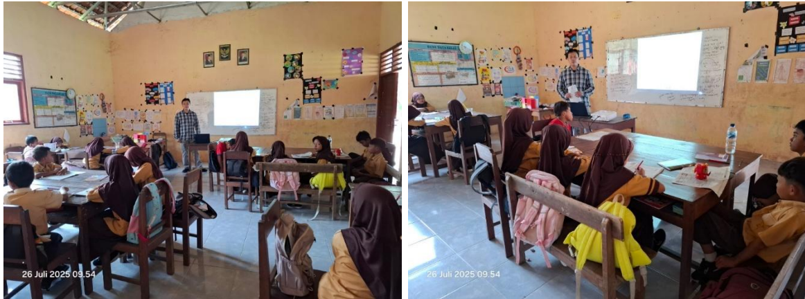
Gambar 1. Dokumentasi Kegiatan