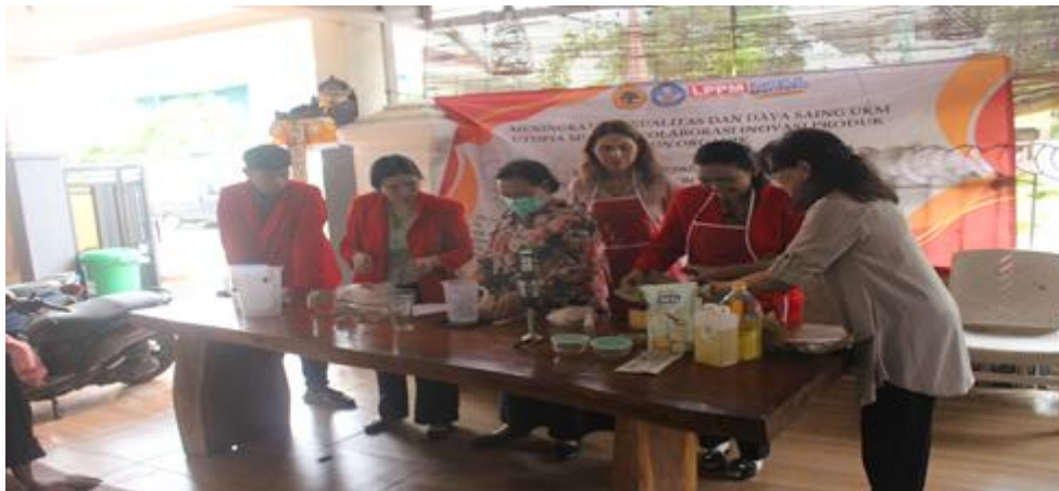
Gambar 2. Pelatihan Pembuatan Sabun Organik