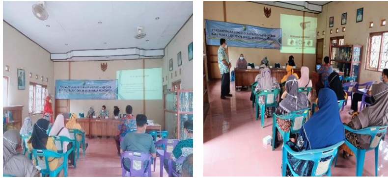
Gambar 3. Pelaksanaan Pelatihan