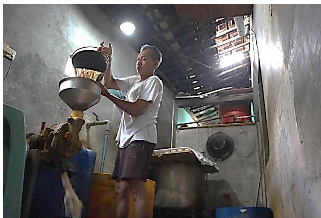
Gambar 1. Aktivitas perajin tempe di Kuripan Kertoharjo

perajin tempe di Kelurahan Kuripan Kertoharjo Kota Pekalongan. Saat harga bahan baku melambung, perajin tempe mengalami kesulitan untuk mempertahankan produksi tempe dengan harga yang dapat dijangkau oleh masyarakat. Perajin mau tidak mau harus melakukan pengurangan ukuran produksi tempe agar dapat dijual sesuai dengan daya beli masyarakat dan agar kegiatan proses produksi dapat terus dipertahankan. Ini merupakan cara klasik yang sering dilakukan perajin tahu dan tempe. Untuk menjaga kelangsungan usaha agar tidak merugi dan gulung tikar, terpaksa produksi dikurangi. Misal yang biasanya sehari memproduksi 40 kilogram tempe menjadi 15 kilogram saja. Tak hanya itu, ukuran tempe juga dikurangi dari sebelumnya satu potong tempe seberat setengah kilogram, menjadi 400 gram saja, harga jualnya pun juga dinaikkan dari Rp5.000 menjadi Rp6.000 per potong tempe. meskipun tidak untung banyak, setidaknya ada penghasilan supaya tidak menganggur. Demi bisa bertahan di tengah tingginya harga kedelai, para perajin juga tidak setiap hari memproduksi tempe, yakni selang seling sehari produksi sehari berhenti produksi (KompasTV Jateng, 2023).