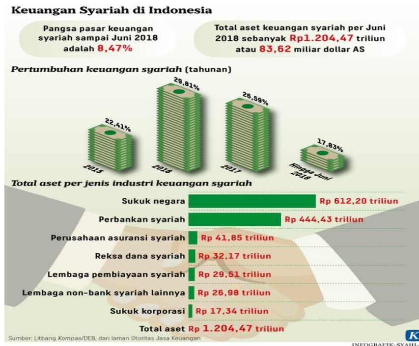
Gambar 1. Instrumen Keuangan Syariah