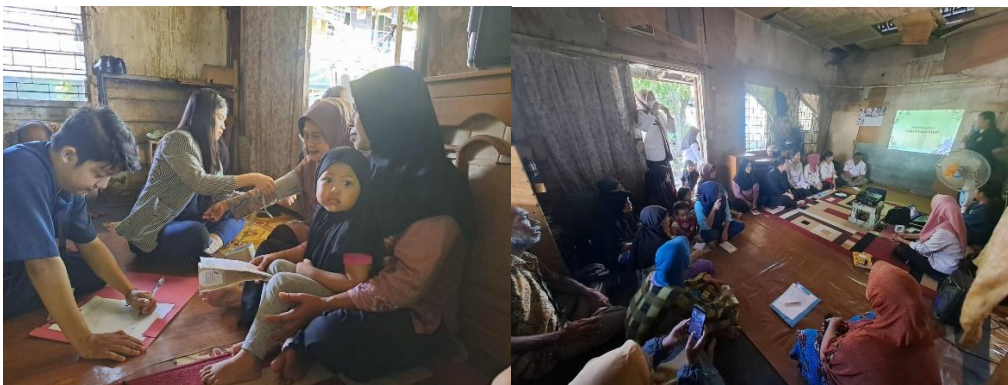
Gambar 1. Pengabdian Masyarakat Edukasi tentang Peningkatan Pengetahuan Hipertensi.

Penyuluhan dan edukasi yang diberikan bertujuan untuk meningkatkan pemahaman masyarakat mengenai hipertensi, termasuk penyebab, gejala, dan komplikasi yang dapat ditimbulkan. Setelah melakukan posttest, Masyarakat juga diberi brosur sebagai referensi untuk mengingat kembali informasi yang telah diberikan dan diingatkan untuk melakukan pemeriksaan tekanan darah secara rutin dan mengikuti pengobatan yang telah dianjurkan.